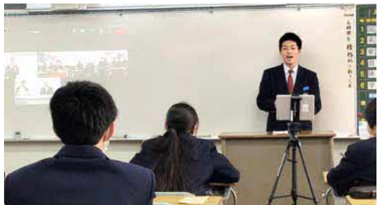
伊方中学校の様子

また、伊方町教育委員会では、オンラインによる英語ショートスピーチトライを昨年度から始めました。各校で、2年生全員が英語のショートスピーチに挑戦し、それぞれの中学校から併せて8名の代表者を選出し、オンラインで結んで発表をしております。このイベントは、順番を決めるコンテストではなく、このスピーチトライに全員が参加することを通して、生徒全員が英語に親しみ、より身近に感じたり、スピーチに挑戦したりし、英語力を高めようとするきっかけになることをねらいとしています。今年度も、1月23日（木）に、オンラインで各中学校を結んで実施しました。各中学校の代表者は、自分の学校生活や将来の夢などについて英語を使って、身振り手振りを交えながら他の生徒に話しかけていました。発表している生徒だけでなく、スピーチを聞いている生徒たちも真剣で、時には笑いも起きるなど、英語に親しむ良い機会となりました。