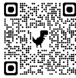
年金手帳が複数ある場合

問 宇和島年金事務所（代表） TEL 0895-22-5440 町民課 住民生活係 TEL 38-2653