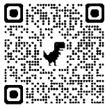
基礎年金番号通知書の再交付

また、反対に年金手帳が複数ある場合は確認方法等、日本年金機構のHPをご覧ください。