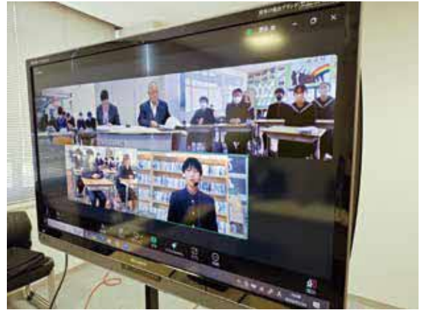
三崎中学校のオンライン発表

ご承知のように、これからの時代は国際化社会、グローバルな社会になっていくと言われています。令和5年末の中長期在留者及び特別永住者は約341万人で過去最高を記録しています。訪日外客数は約3,700万人で前年と比べて約47%の増で、過去最高を記録しています。これからは世界をフィールドにして仕事をしたり、生活をしたりすることが当たり前となり、日本や伊方に住んでいても、海外の人やものとの関わりはどんどん増えています。現在、伊方町には100人ほどの外国の方が暮らしています。伊方町の100人の中のおよそ1.4人は外国の方です。このような時代をたくましく生きていくためには、国際的に使われている英語を活用する力が必要となります。もちろん、その背景にある相手の文化を理解することも大切です。