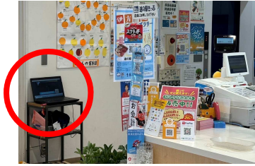
道の駅きらら館 レジ横