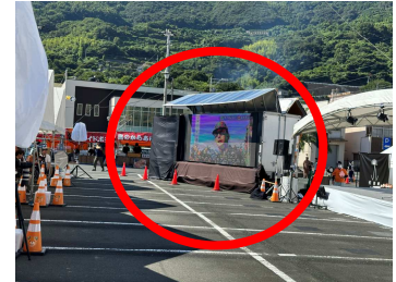
きはなはいや伊方まつり