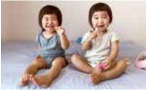
【一般】知事賞「歯磨きたのしいな☆」