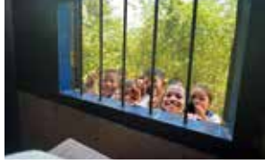
【小中高】知事賞「最高の笑顔」