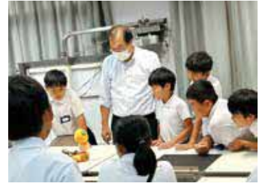
(プログラミング教室)

現在、伊方町の各小中学校では、小規模校の特色を生かし地域と協働するなど、特色ある教育が為され、様々な面で成果を上げております。しかし、人口減少による極小規模校化が様々な面で影響を与えてきており、同じように、生涯学習の分野においても、それは顕著になってきています。町の人口減少防止・抑制の対策は重要であり、教育についても最重要の課題であります。