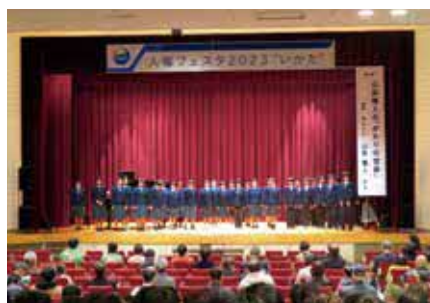
【人権フェスタ2023いかた】

人権擁護委員法に基づいて法務大臣から委嘱された委員のことです。報酬はありません。人権相談を受けたり、人権侵害による被害者の救済をしたり、人権についての啓発活動を行ったりしています。現在、伊方町では、5名の人権擁護委員が活動しています。