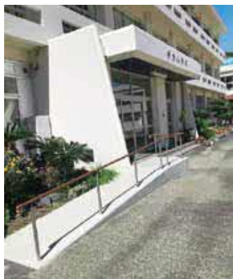
【伊方小学校の玄関スロープ】

障がいがある人や高齢者など、日常生活や社会生活に制限を受けている人の障壁を取り除く対策を合理的配慮と呼びます。例えば、車いす利用者のためにスロープを作ったり、高齢者にもわかりやすいように表示の文字を大きくしたりすることです。施設や店舗を利用する人から要請があった場合は、町や事業者は、その負担が過重にならない範囲で対応しなければなりません。