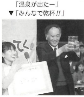
「温泉が出たー」 ▼「みんなで乾杯!!」