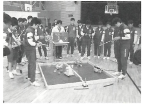
▲ロボコン対戦中(伊方中)