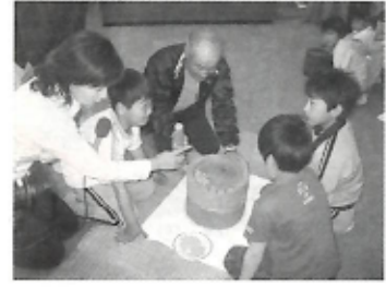
▲「昔はこれで豆を挽いたもんじゃ」「スゲー。」