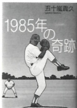
五十嵐 貴久 著

◎開室日時 火曜日～金曜日 13:00～16:30 土曜日 10:00～16:30 (12:00～13:00は休室) ◎閉室日 日曜日、月曜日、祝祭日、お盆、年末年始 ☆ひとり5冊まで 1ヶ月間借ります。