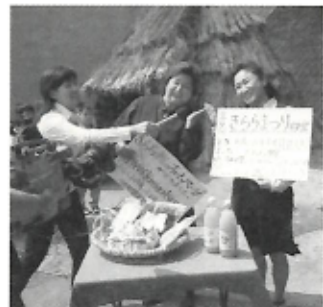
▲伊方町の小林幸子さん(右)と天童よしみさん(左)