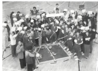
▲伊予路てくてくエンディング「伊方よいとこ、ふんえ〜い！」