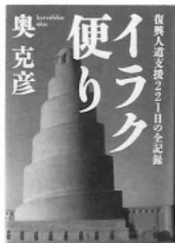
奥 克彦 著