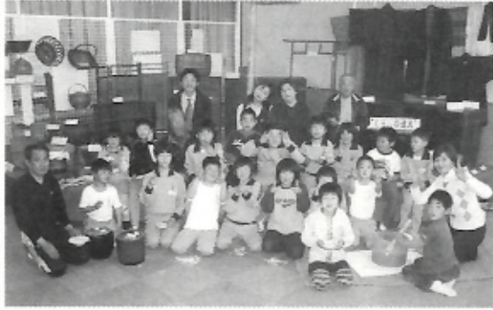
▲出演した二見小の皆さん「みんな見てくれたー」