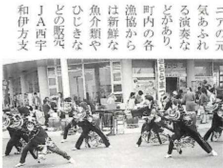
伊方堂々太鼓及びジュニアによる演奏

店は農作物の販売、町商工会は金太郎イモの焼きいもなどを販売、伊方サービス(株)は焼きホタテの販売などが行われました。その他、伊方杜氏の造った新酒など、各種団体からも多数の出品があり、特産品を買い求める大勢の人で会場は賑わいました。