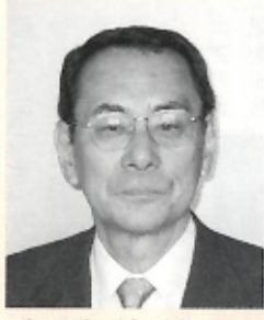
一 洋 医師 後 町