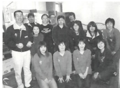
▲早朝から爽やかな笑顔の(株)ニュースの皆さん

の皆さんは、少し緊張気味でしたが、良い思い出になったことでしょう。撮影の現場風景をご覧ください。