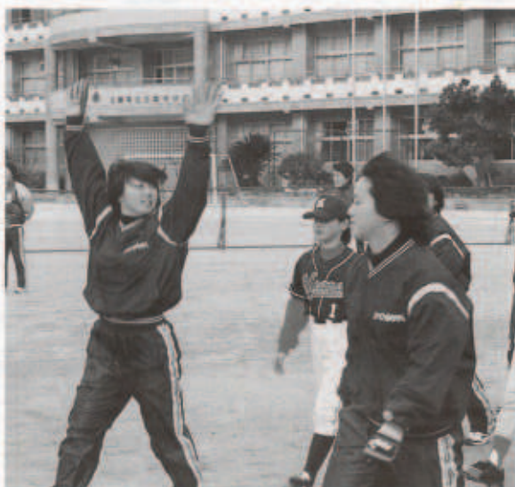
ウォーミングアップに時間をかけて