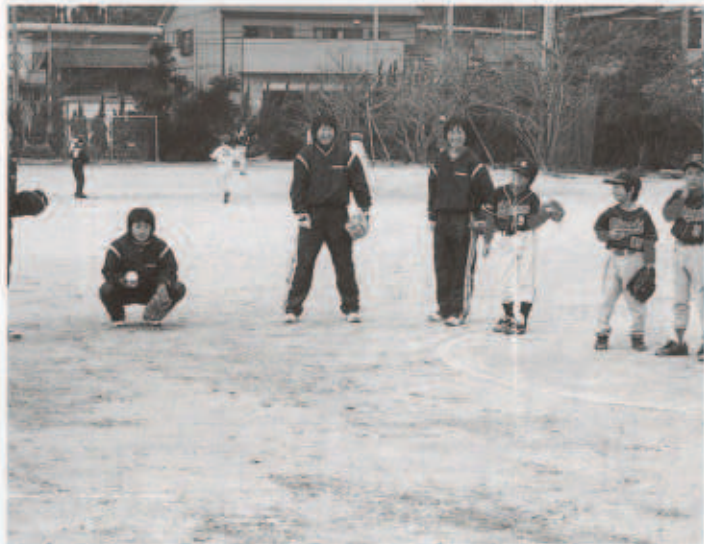
思わず笑みがこぼれる指導風景

今後もこの活動が地域スポーツの振興のため継続して実施されることを関係各位にお願いしたいと思います。