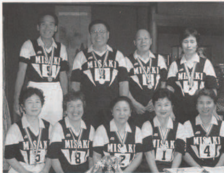
「みさき55」チームのみなさん