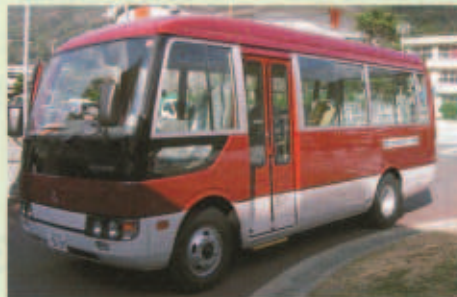
運行している曜日 月～土曜日(日曜、祝日は運休)

町民の皆さんから多数の要望がありました町営バスの運行を一月五日から実施しております。 バスは二十六人乗りで民間業者が定期便を運行していない南部、神松名方面を一日二便無料で運行いたしますのでどうぞご利用ください。