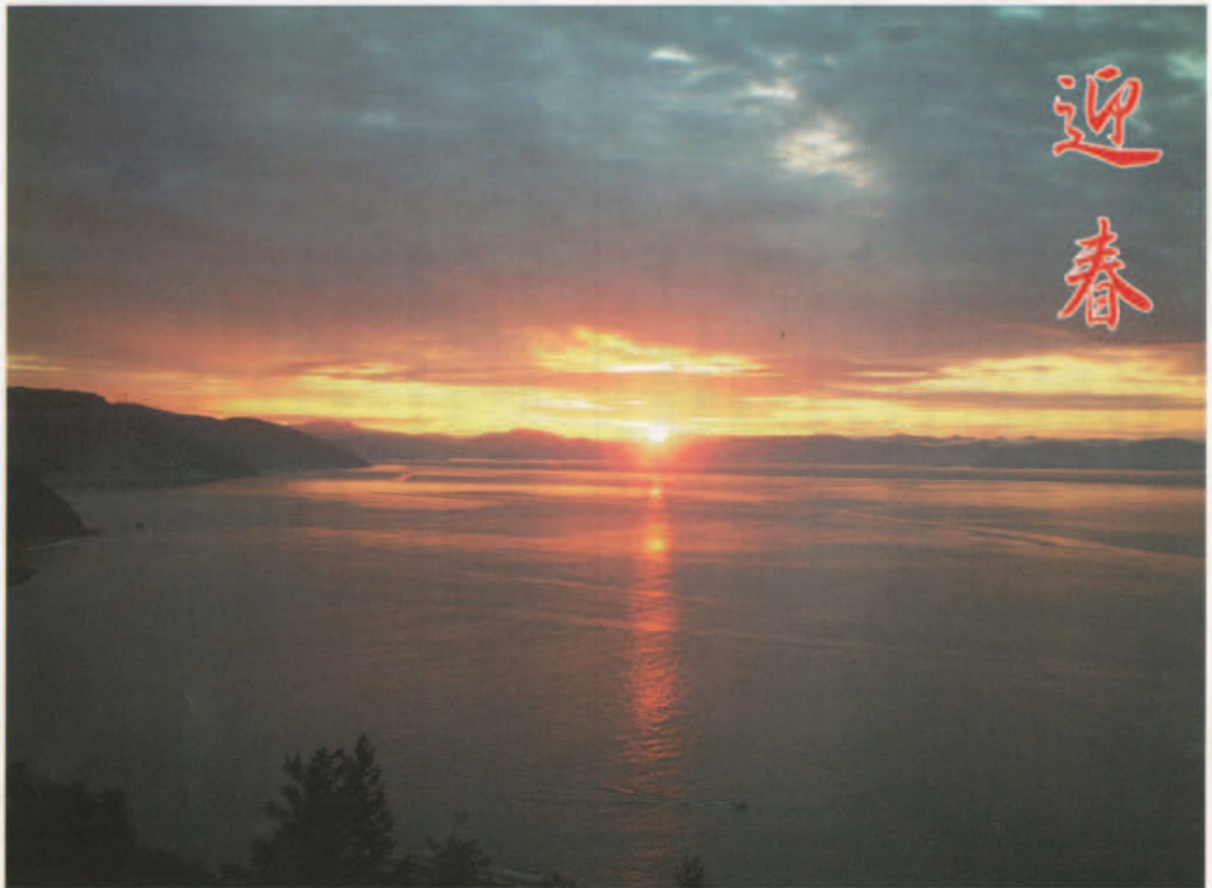
名取から朝日を望む