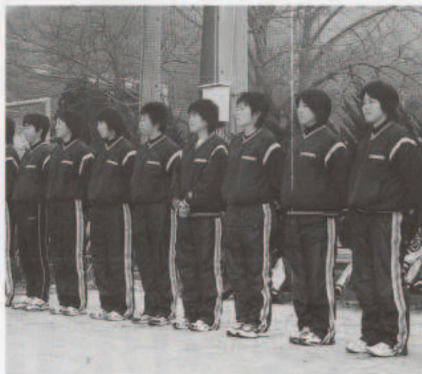
女子ソフトボール部のみなさん

指導内容はウォーミングアップから送球、捕球、バッティングと全般にわたるもので、伊予銀行の