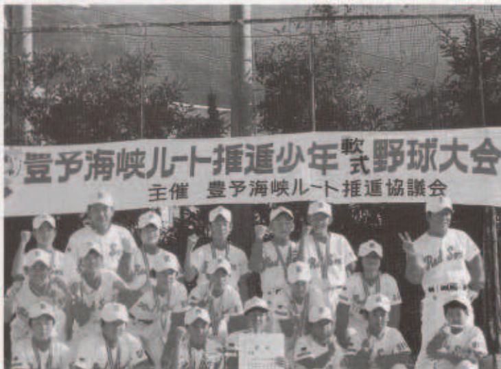
優勝を喜ぶ三重レッドソックスチーム