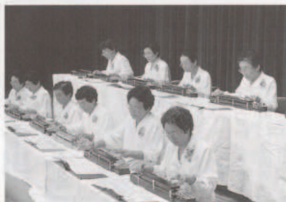
日頃の練習どおりにできたかな