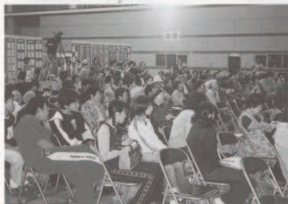
公演に見入る観客のみなさん