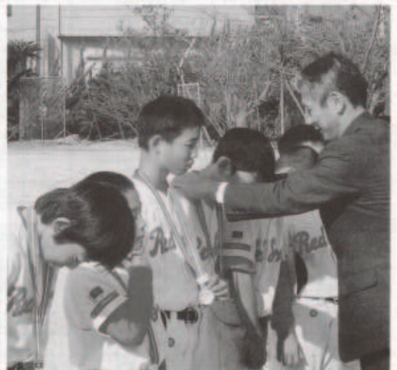
優勝のメダルを授与する三好局長