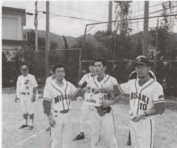
募金ありがとうございます