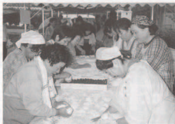
もちづくりに精を出すボランティアのみなさん