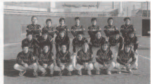
伊予銀行女子ソフトボール部のみなさん