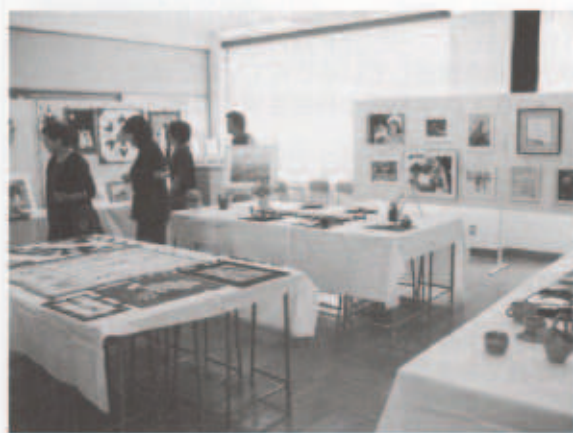
(地域の方の趣味の作品展)

の演奏を聴くことがあると思います。そのときはさらに上達した私たちの演奏を聴いてもらえるように日々の練習をがんばりたいと思います。