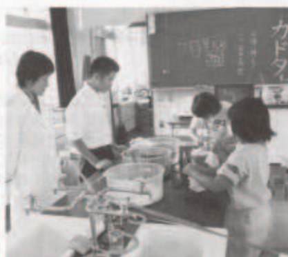
(美術同好会による染めもの屋)