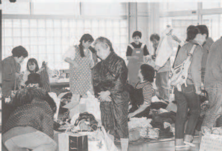
にぎわうフリーマーケット