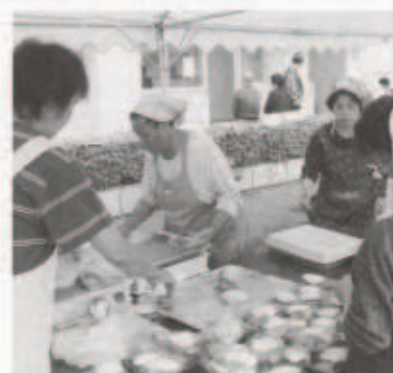
(老人クラブによる郷土料理)