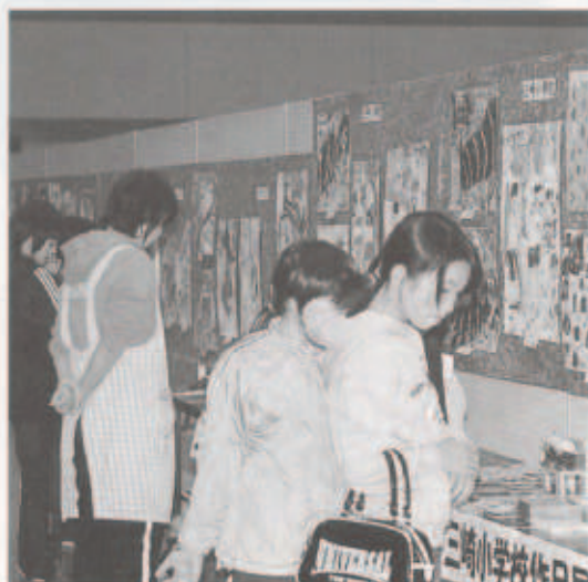
力作がそろそろ小中高生作品展