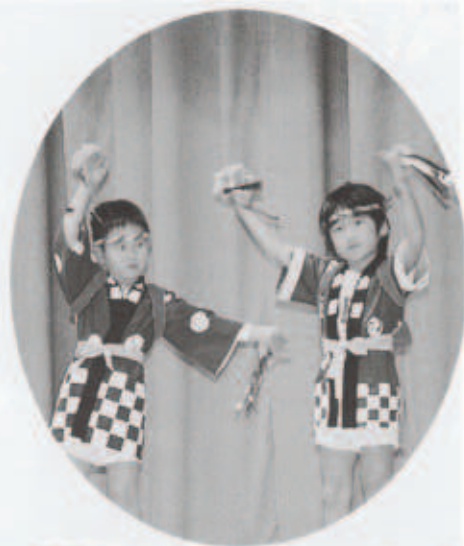
園児のかわいいおどりでオープニング

後援団体、実行委員の団体、協賛団体の皆さん方には絶大なるご協力をいただき大変ありがとうございました。