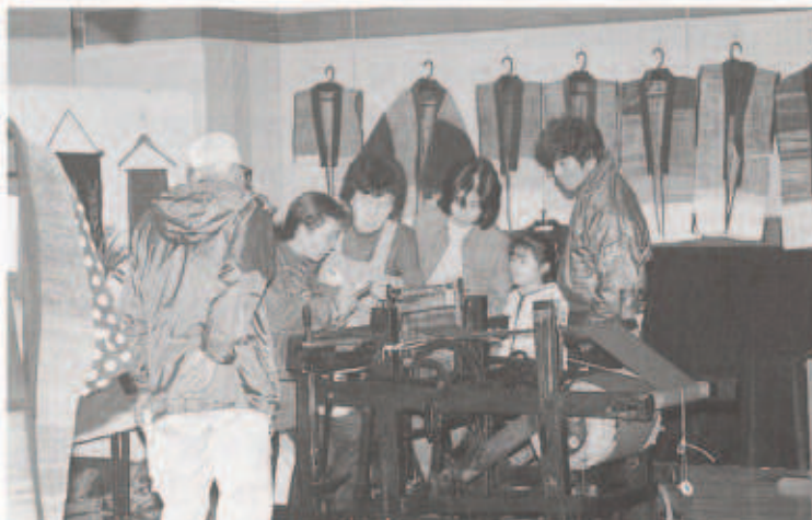
裂織の実演コーナー