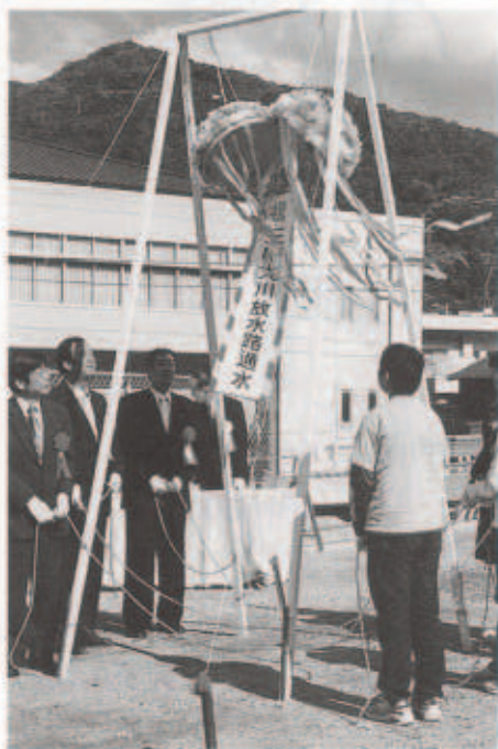
くす玉を割る県出納長等関係者