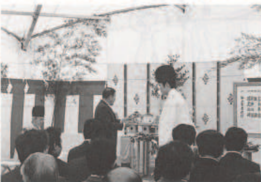
地権者代表が神様に捧げる玉串奉奠の儀

11月8日(金)低地のため、台風の影響毎に冠水が心配された三崎大川に巨費を投じての放水路が完成。宮内県出納長をはじめ、地権者及び関係者を集めて、盛大に通水式が開催されました。広々とした河川と通水路が水害から地域を守り、その能力を遺憾なく発揮することでしょう。