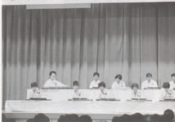
あてやかなステージが続きます