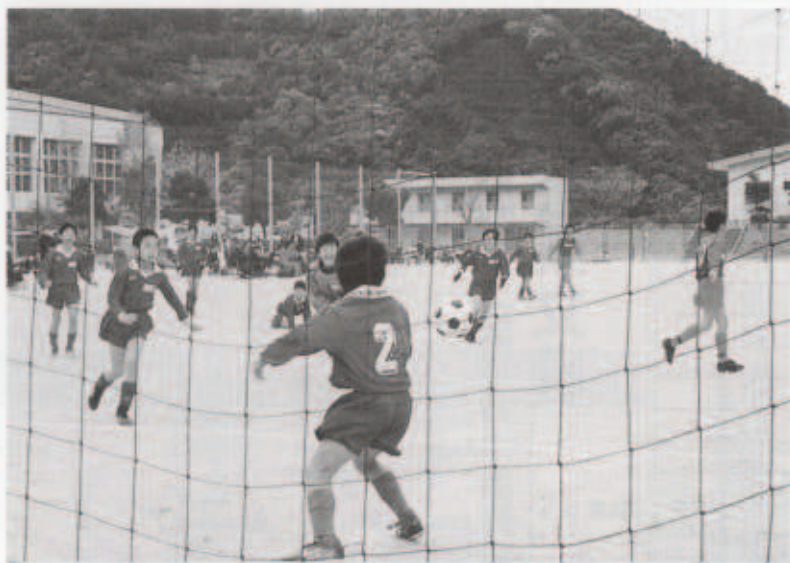
それっつけ シュートだ