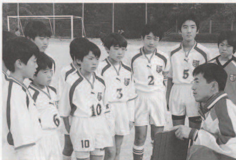
監督の指示に熱心に聞き入る選手たち