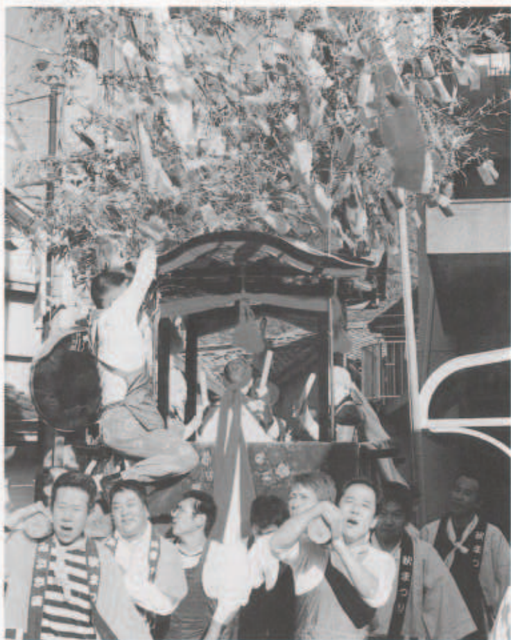
三崎商店街を練り歩く四ツ太鼓

の見上げるような櫓。その櫓と変わらぬ巨大な牛鬼を立て掛け、かつぎ上げ、四ツ太鼓との鉢合わせに望む。 数年来、西組・源氏方の四ツ太鼓に敗れることが多く、捲土重来を期しての巨大化か。 唐獅子、五ツ鹿、相撲甚句、浦安の舞が披露された中入り後の最後の一戦。垂直近くを立て掛け、四ツ太鼓に乗り合わせた稚児が恐怖に大きく揺らぐも、必死に「センシユガラクダイ」(※千秋楽だよ、めでたい。の意か)と声を張り上げ、太鼓を打ち鳴らす。見事に東組・平氏方の牛鬼が勝ちを収めた。取り囲む群衆から沸き上がる拍手喝采の嵐に東方の若者たちの真っ赤な顔がくしゃくしゃになる。