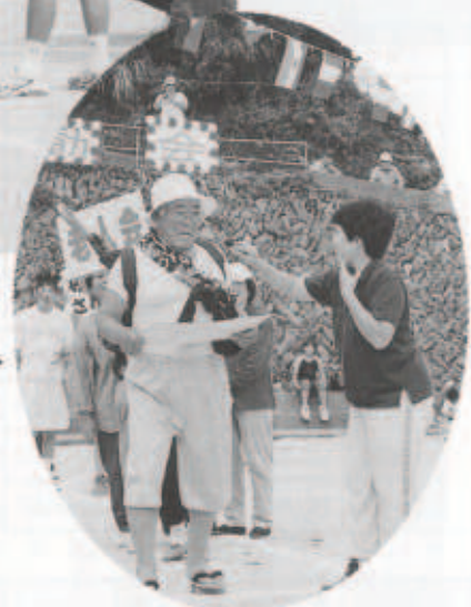
名取の山下清。▶ さて誰でしょう。