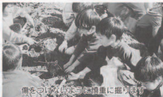
傷をつけないように慎重に掘ります