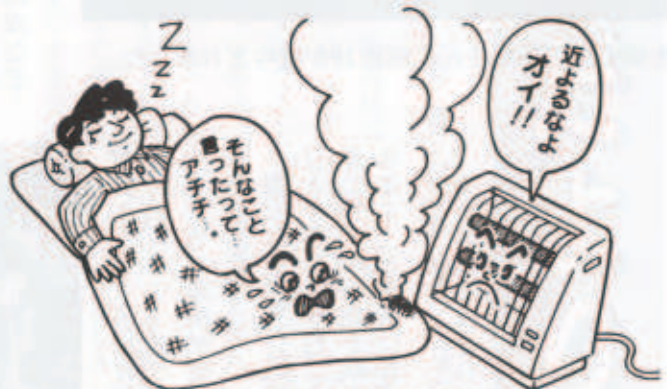
ストーブの周りは整理整頓!!