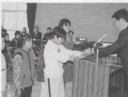
人権作品の表彰式