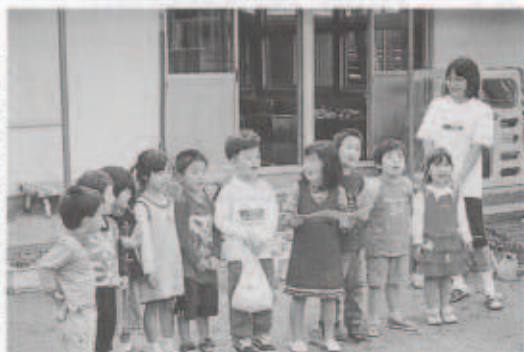
みんなでお礼のことはを

委員さんから各保育園児にチューリップとフリージアの球根が贈呈されました。 園児のみなさんは「毎日をたくさんあげて、春にきれいな花を咲かせます。」と元気に答えていました。 来年の春にはきれいな花が咲くよう、みんなで大切に育ててください。