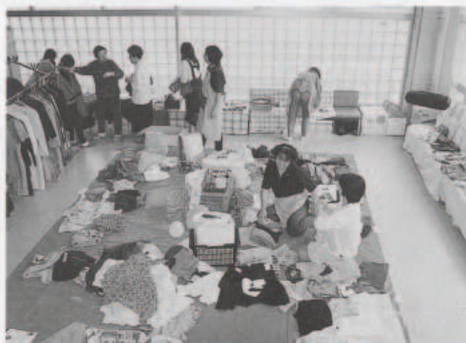
にぎわうフリーマーケット

ステージでは、三崎高校生の景気のよい太鼓で幕があき、歌や踊り、演奏などが華やかに彩り会場を盛り上げ、みさきの文化を満喫しました。