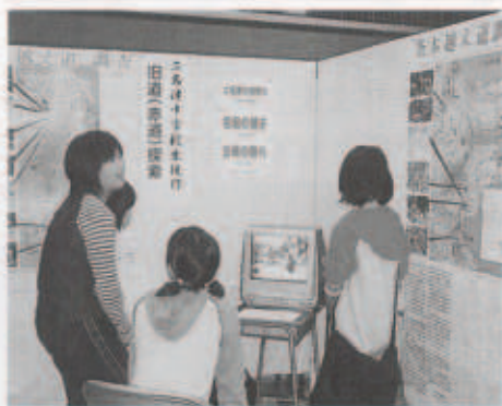
二名津のおまつりを VTRで放映

ステージでは、三崎高校生の景気のよい太鼓で幕があき、歌や踊り、演奏などが華やかに彩り会場を盛り上げ、みさきの文化を満喫しました。