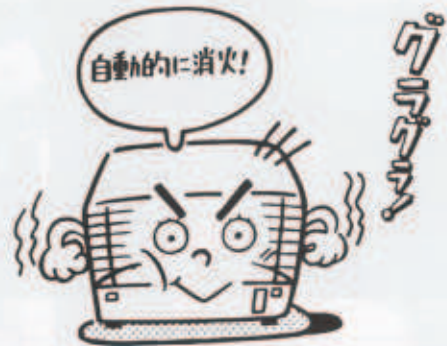
耐震装置の確認をしましょう!!