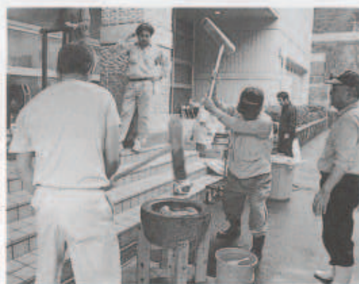
味は一番、きねつぎの餅