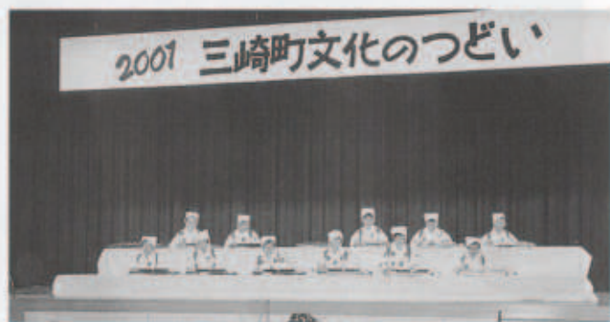
ステージを彩どる演奏

当日は、あいにくの雨模様とあって、戸外で計画されていたバザーや物産店・フリーマーケットなどは、急きょ会場の変更を強いられたものもありましたが、そのせいもあってか主会場となった総合体育館は、例年以上のにぎわいをみせました。会場では町内各文化グループの作品や、各小中高等学校からの作品などの展示がなされました。また、毎年テーマを持って三崎の歴史を紹介する文化財保護審議会のコーナーでは「はかる道具」をテーマになつかしい道具がところせましと並べられていました。