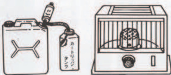
給油をする際は必ず火を消してから!!