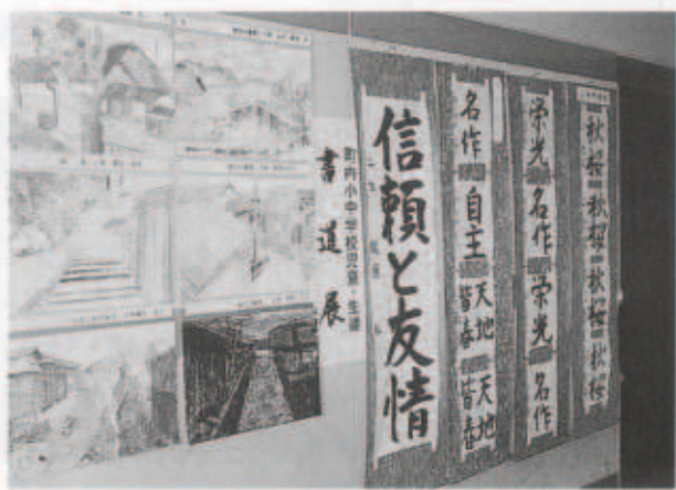
小中学生の、のびのびした作品展