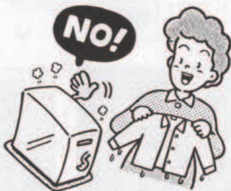
ストーブは暖房以外使わない!!

寒い冬がやってきました。ストーブやコタツ等を使用する機会が多くなってきます。毎年、全国でストーブ等が原因で火災が多く発生しています。正しい利用方法を身につけましょう！ぜひ参考にしてみてください！