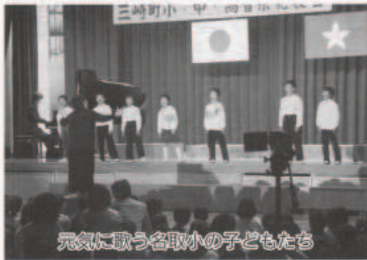
元気に歌う名取小の子どもたち