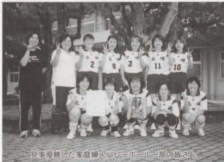
見事優勝した家庭婦人バレーボール部の皆さん

余儀なくされる種目もありました。予定通り行われた室内競技においては、三崎町の代表チームは各種目で大活躍でした。そんな中、家庭婦人バレーボール1部では、1回戦からすべてストレートで勝ち上がった三崎チームは、昨年決勝戦で破れた宇和チームに雪辱を果たし、見事優勝をしました。また、バド