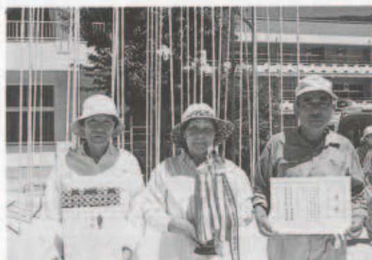
1部優勝の松長福会チーム