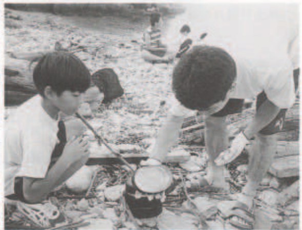
ごはんは、おいしくたけたかな！

7月24日(火)～26日(木)の三日間、佐賀関町の無人島(高島)で子どもたちの野外体験キャンプを実施しました。今年で4年目を向かえるこのキャンプ、不便さへの挑戦を目的に無人島体験にしばって計画を立ててから、2年連続台風に見まわれ無人島へわたることができませんでした。しかし、今年絶好のキャンプ日より恵まれ、参加した子どもたちとスタッフはいざ高島へ渡りました。さいわい現地は、キャンプ場もあり飲み水には不便しませんでした。毎回の食事はすべて手作りであって、飯盒でごはんを炊くのにもすっかり慣れました。三日間のキャンプを終え、子どもたちの表情には満足感が漂い、一回りたくましくなったように感じました。