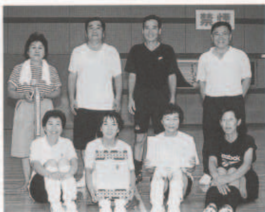
レクバレー優勝の上チーム