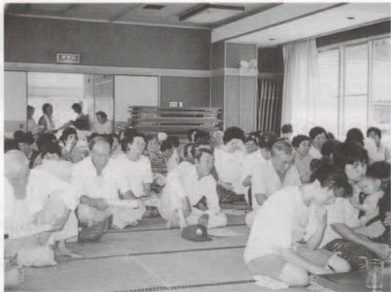
(8月2日 名取集会所において)

さる7月16日の与修地区を皮切りに、8月6日までの間、町内でごみの分別収集と減量化の説明会を地区毎に開催いたしました。昼間の開催にもかかわらず、782名もの皆様の参加が得られ、ごみに対する関心の深さは何えしました。暑い最中のご参加、大変ありがとうございました。チラシのとおりのごみの分別と減量化の推進につきまして、ご協力の程よろしくお願いいたします。