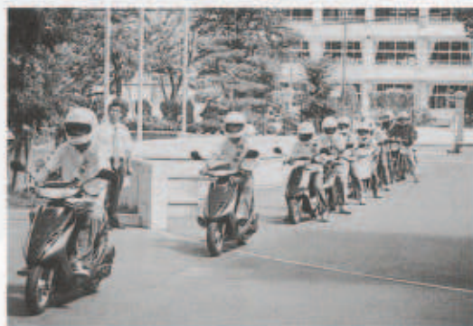
パレードに出発するバイク通学生

7月23日(月)、三崎高校のバイク通学生18名が交通安全パレードを行いました。パレードに先駆けて役場前駐車場で行われた出発式では、ブレイキやライトなどの始業点検を実施。その後、パトカーを先導にパレードに出発しました。生徒たちは、手作りの交通安全タスキを掛け、自分たちで吹き込んだ広報テープを流しながらパレードを行い、安全運転やシートベルト着用の徹底などを呼び掛けました。