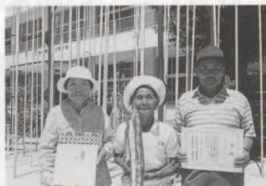
2部優勝の阿弥陀チーム