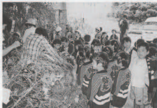
防火の願いを短冊へ

8月7日(火)、消防署第一分署では月遅れの七夕祭りが行われました。この七夕祭りには、三崎・二名津保育園と瀬戸保育園の園児たちが参加。園児たちは、防火の願いを書いた短冊を笹に結んだ後、防火映画や劇などを通して、「絶対に火遊びをしない」などの3つの約束をしました。最後に行われた放水の体験では、園児全員でホースを持ちみんなで協力して火点めがけて放水しました。