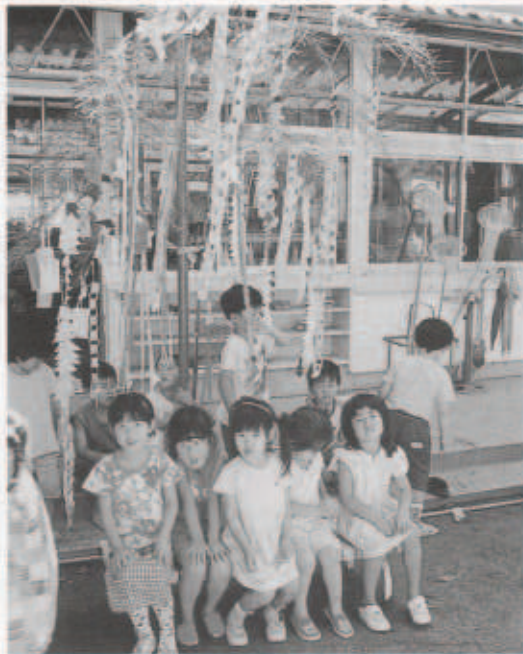
きれいに飾りつけられた笹の前で

園児たちは、それぞれの願い事を書いた短冊をひとつひとつ笹に飾りました。短冊に書かれた願い事はさまざまで、園児たちの素直な気持ちそのまま短冊に用意された笹は、色とりどりの短冊や輪つなぎなどの飾り付けでとてもきれいになりました。 みなさんの願い事がひとつでも多くかなうといいですね。