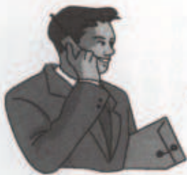
その場に居合わせた人

救急事故が発生した時、現場付近に居合わせた人（バイスタンダー）が、適切な応急手当を速やかに行うことにより、傷病者の救命率が向上することは、医学的にみても明らかになっています。ところが、救急事故発生現場に救急車が到着するまでの間に、バイスタンダーが何ら応急手当を施すことなく処置されている事例は少なくありません。傷病者の救命のためには住民による速やかな応急手当・救急隊員の応急処置と搬送・医療機関での処置の三者が必要不可欠になってきます。その場に居合わせた「あなた」の迅速な応急手当と119番通報は、救命リレーのスタートです。