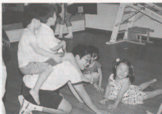
いつも元気いっぱい園児たち

7月3日(火)、三崎中学校の3年生9名が三崎保育園を訪問しました。園児たちは、中学生のお兄さん、お姉さんたちが来るやいなや大はしゃぎ。中には元気余って泣き出す園児もいましたが、肩車をしてもらったり、追いかけっこをしたりと元気いっぱい遊びました。