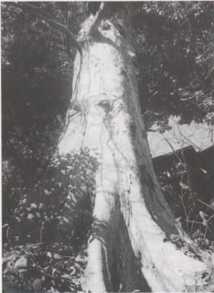
写真は、三社神社(平磯)にあるムクノキ(ニレ科)です。 高さ35m、幹周4m37cmで、八西地区のムクノキの 中ではで最も高いのではないかとわれています。