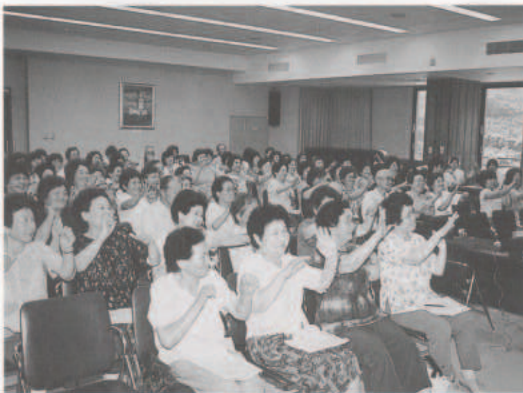
講座で行われた体操に全員が参加

その後、脳卒中の看護についての講義や松山赤十字病院の看護婦さんによる血圧測定・体脂肪測定などが行われ、この講座が自分の健康を考える良い機会になったことでしょう。