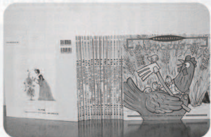
世界名作えほんライブラリー