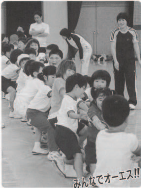
みんなでオーエス!!