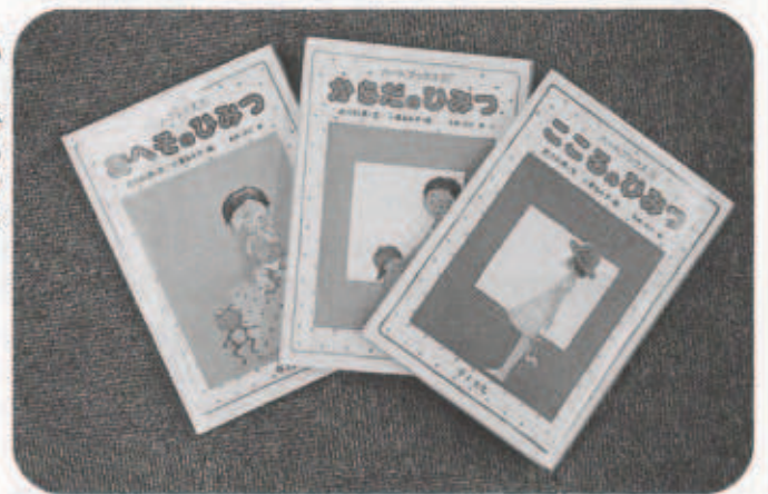
ハートブックス 「からだのひみつ」シリーズ