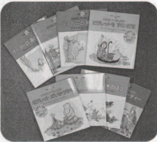
「おはなしブーさんえほん」のシリーズ