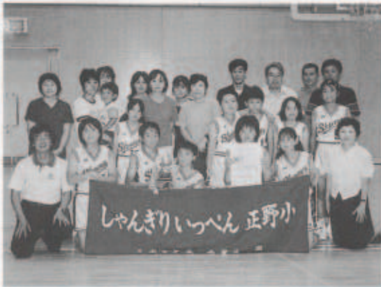
優勝カップを手に喜ぶ正野小の皆さん