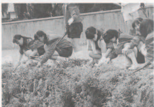
汗だくになりながら、一生懸命清掃しました

7月9日(月)、三崎高校の生徒によるクリーン愛媛運動が、三崎大川で行われました。生徒たちは、生い茂った草を汗だくになりながら刈ったり、刈った草を集めたりと分担して作業を実施。清掃の終わった三崎大川は、見違えるほどきれいになりました。