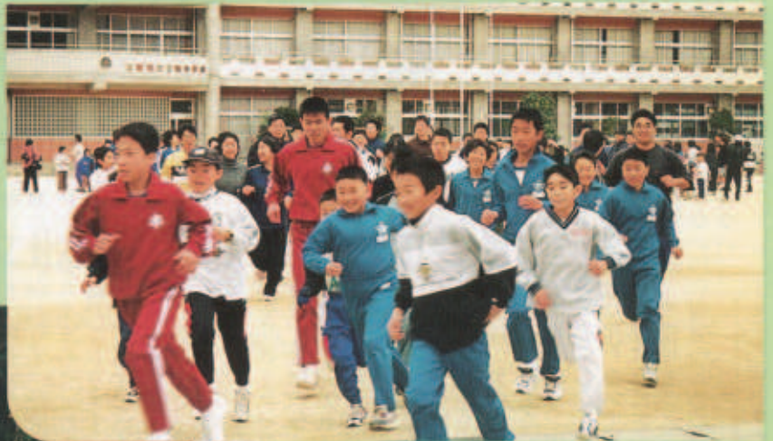
健康マラソン(1月2日)