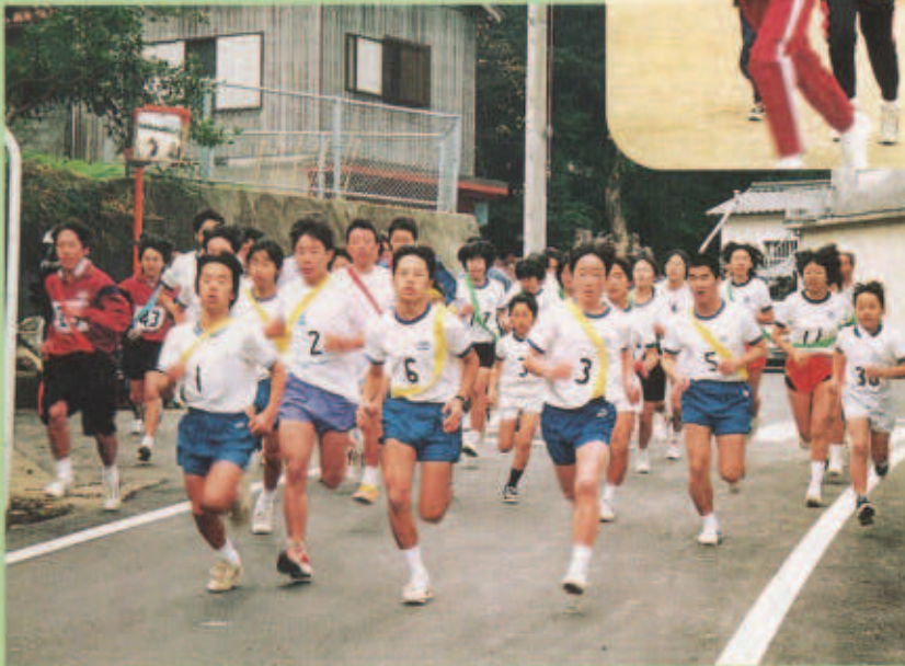
三崎町駅伝大会(1月15日)