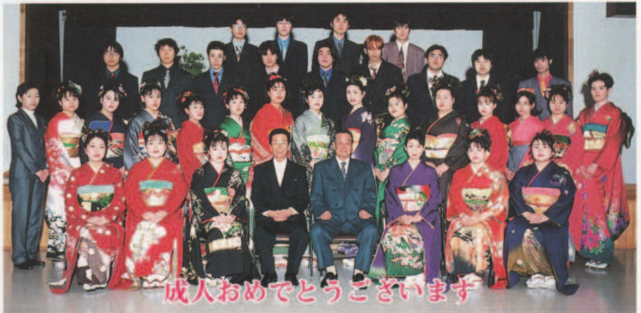
成人おめでとうございます