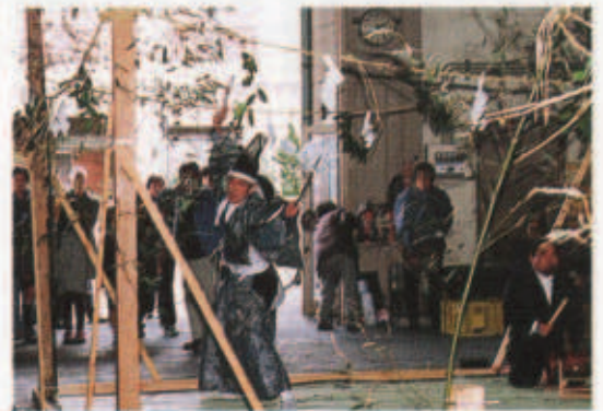
「お十五日」お伊勢踊りを奉納 (1月15日 三崎地区)