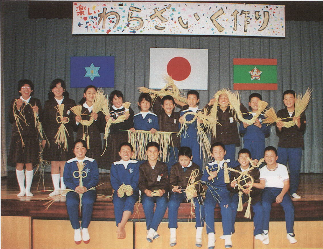
きれいにできたヨしめ飾り お年寄りを“先生”に(水ヶ浦小学校)