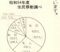
昭和54年度住民移動調べ