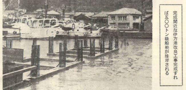
農業構造改善事業の一環として完成した選果場