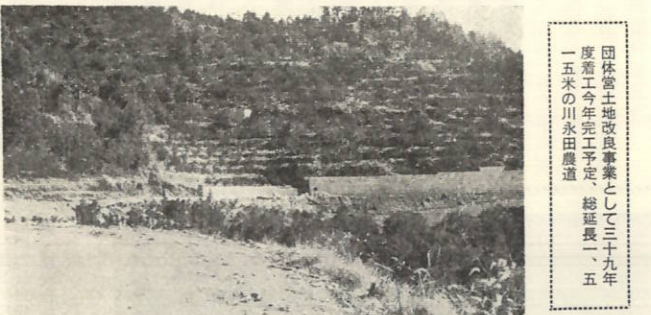
団体営土地改良事業として三十九年度着工今年完工予定、総延長一、五五米の川永田農道