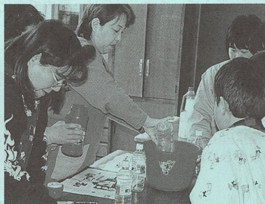
EM菌での洗浄液づくりの様子