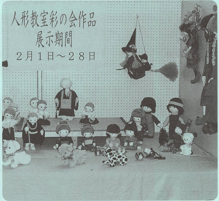
ロビーを飾るかわいらしい人形たち

二月一日から二十八日までの一ヶ月間、役場ロビーにおいて、人形教室「彩の会」による作品展示会がおこなわれました。