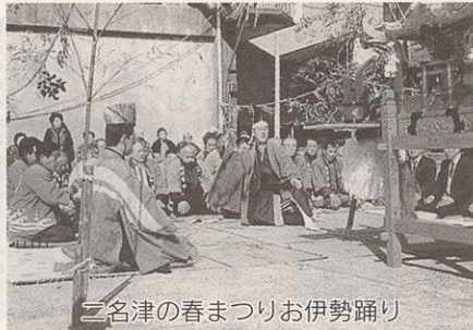
二名津の春まつりお伊勢踊り