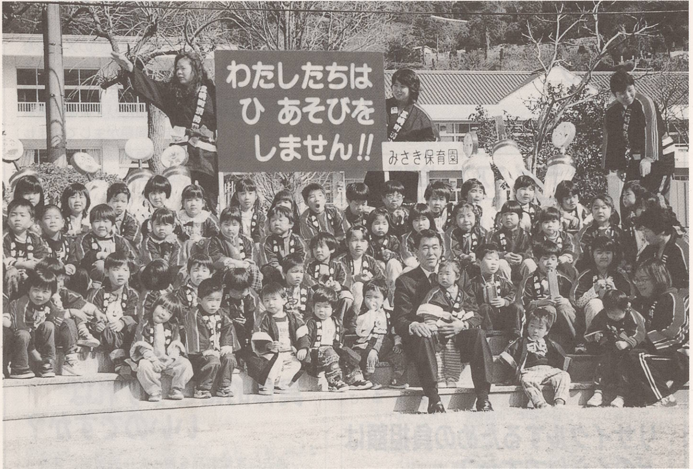
三崎保育園幼年消防隊