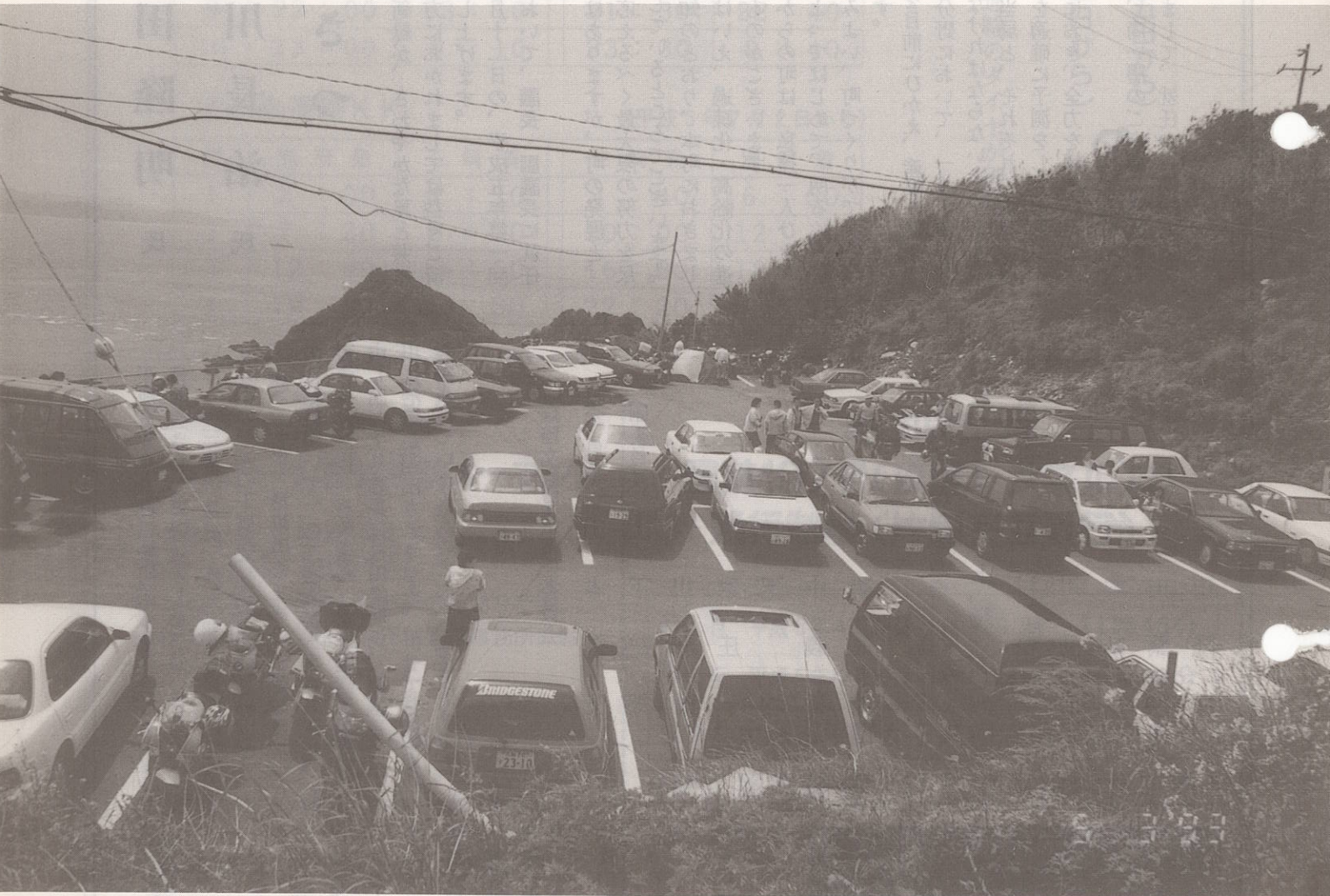
佐田岬灯台駐車場 5月3日の観光客は3,300人でした。