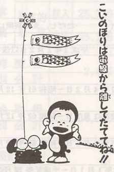
こいのぼりは電線から離してたてましょう

こいのぼりのシーズンとなりました。こいのぼりは、電線から離してたてましょう。もし、こいのぼりが電線に巻きついた時は、大変危険ですから、竿などでつついたりせずに直ぐに四国電力までご連絡下さるようお願い致します。