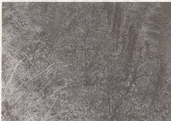
暴風雨で果実が落下した柑橘園