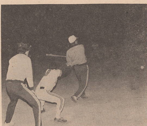
ダイダイできたえた腕で一発

ソフトボール愛好者で、大変楽しみにしてチーム数も二十五チームの夜間リーグ戦が、ムと増え、試合の順番が、四月二十三日より一週間一試合ずつ開幕して、連夜、二試合、各選手は「大変の熱戦をくりひろげまちどおしい」の声で