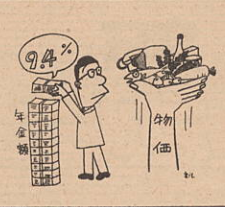
7月分(国民年金)9.4%の増額スライド実施

これは、昭和五十一年度の物価上昇による目減りを補完するためのもので、これが実際に受取れるのは、六、七、八の各月分が支払われる九月の支払期日からになります。