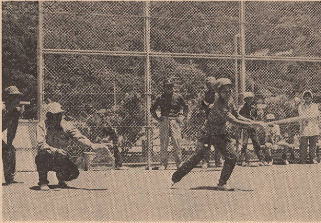
サーーこい！ あたった！

去る六月十九日、大佐田公民館の一環として、佐田小学校において、スポーツ大会が開催された。