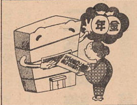
(必ず鑑定請求を—国民年金を受けるには)

国民年金では、自然公園や温泉地など、めぐまれた環境の中に、国民年金の被保険者、受給者はもちろん、どなたでも利用できる「国民年金保険センター」を全国で二十一ヶ所設置しています。四国で唯一の国民年金保