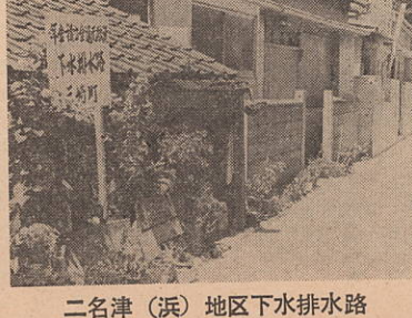
二名津(浜)地区下水排水路

本町では、毎年度、公共施設の整備拡充をはかるために、皆さんが納めていただいた国民年金の掛金の積立金を国から借入れておられます。昭和50年度にはこのお金を借入れて次の3施設が完成しました。なお、事業に要した財源のうち、起債額が皆さんが納めていただいた国民年金の掛金の積立金を国から借りたお金です。