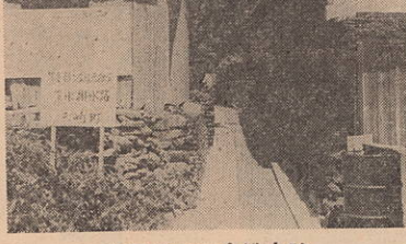
中尾地区下水排水路