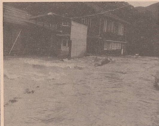
氾濫する三崎大川