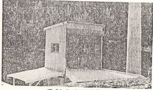
完成したゴミ焼却場正面