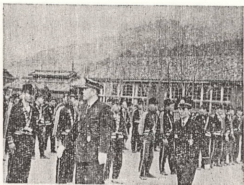
点検 服装 人員

状、記念品がわたされ正午無事終了した。しかし、消防団員の方々は、すぐまた忙しい仕事をもちながら、日夜火災防止に不平不満なくその活動を続けて行く。私達町民もこの消防団に一致協力し「火災はおこさない」という心がまえで、日常生活をして行きたいものである。