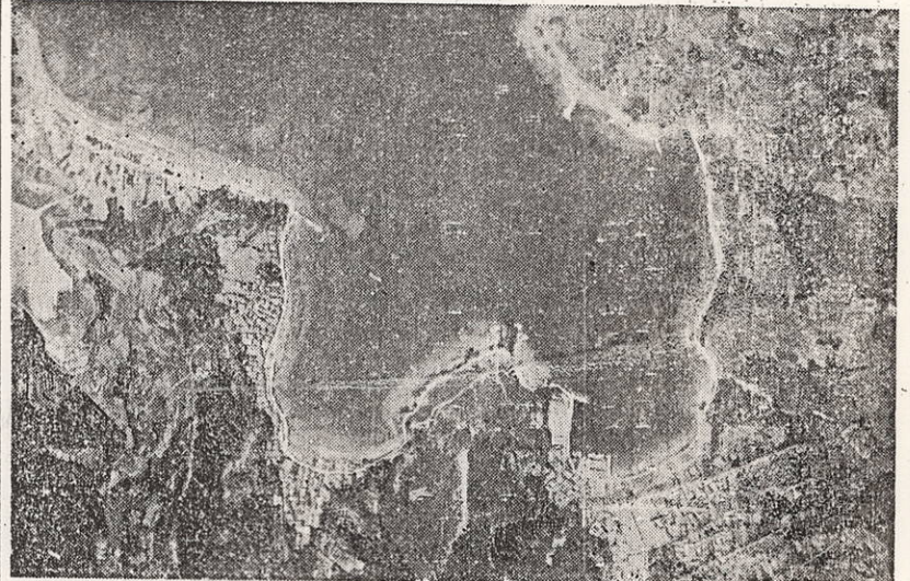
写真広報No.2 佐田大佐田井之浦

母子家庭への資金貸付 母子家庭への資金貸付は、母子家庭の生活を支えるために、町が資金を貸付する。資金貸付の額は、母子家庭の生活状況に応じて、資金貸付の額が増える。資金貸付の額は、母子家庭の生活状況に応じて、資金貸付の額が増える。