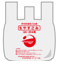
もやすごみ (小) 20ℓ用