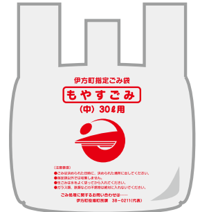
もやすごみ (中) 30ℓ用