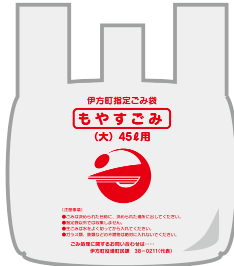
もやすごみ (大) 45ℓ用