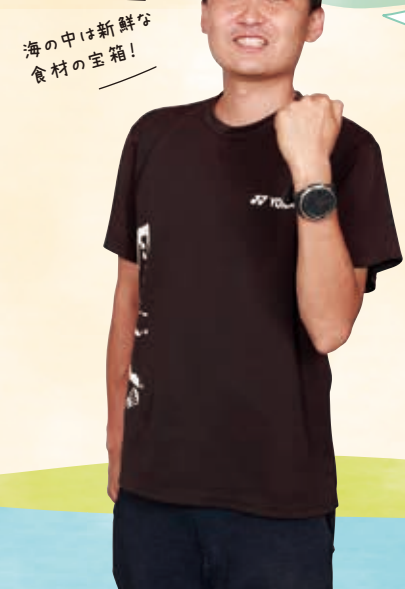
海の中は新鮮な 食材の宝箱!