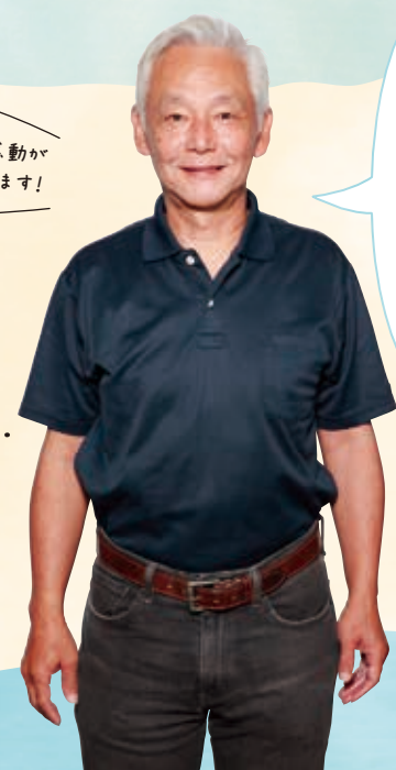
潮風と感動が あなたを待っています!