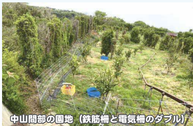
中山間部の園地(鉄筋柵と電気柵のダブル)