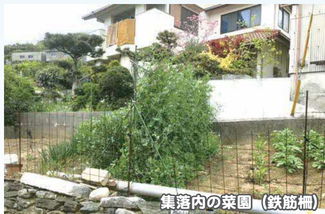
集落内の菜園(鉄筋柵)