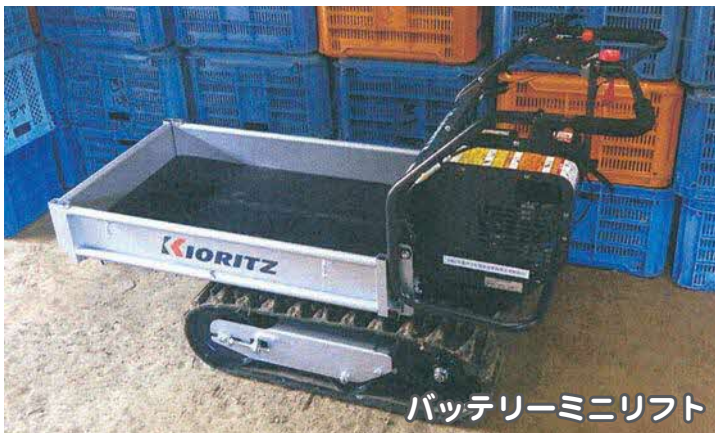
バッテリーミニリフト