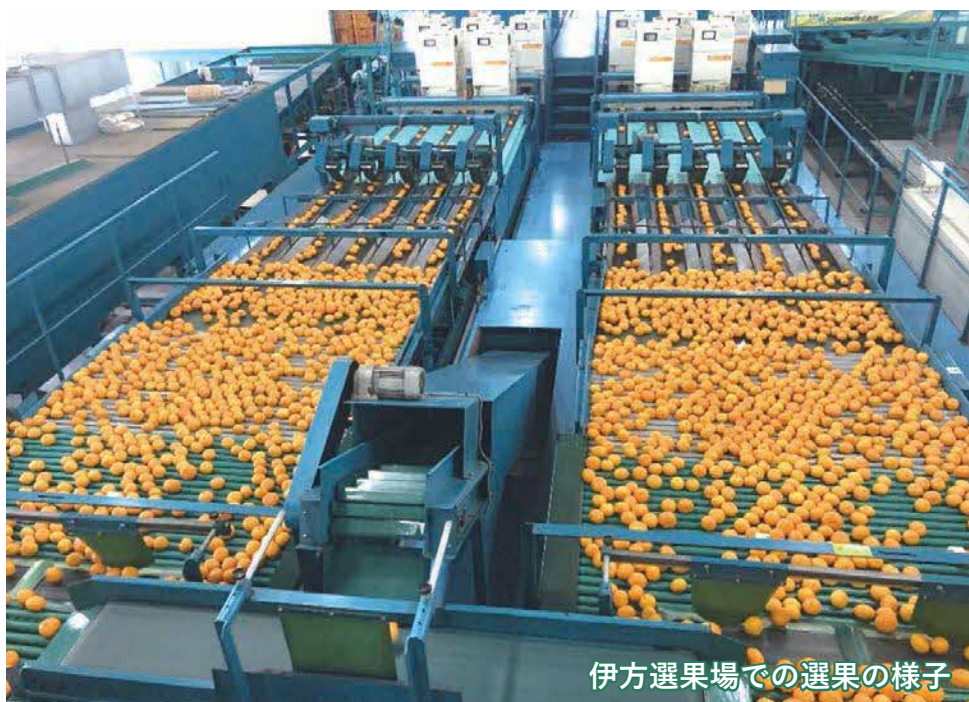
伊方選果場での選果の様子

単価については、極早生販売の苦戦を受け、令和元年度並みの相場となりました（現在のところは、ほぼ昨年並み）。昨年度に続きコロナ禍の販売ではありますが、現在のところ比較的スムーズに荷物は動いている状況です。