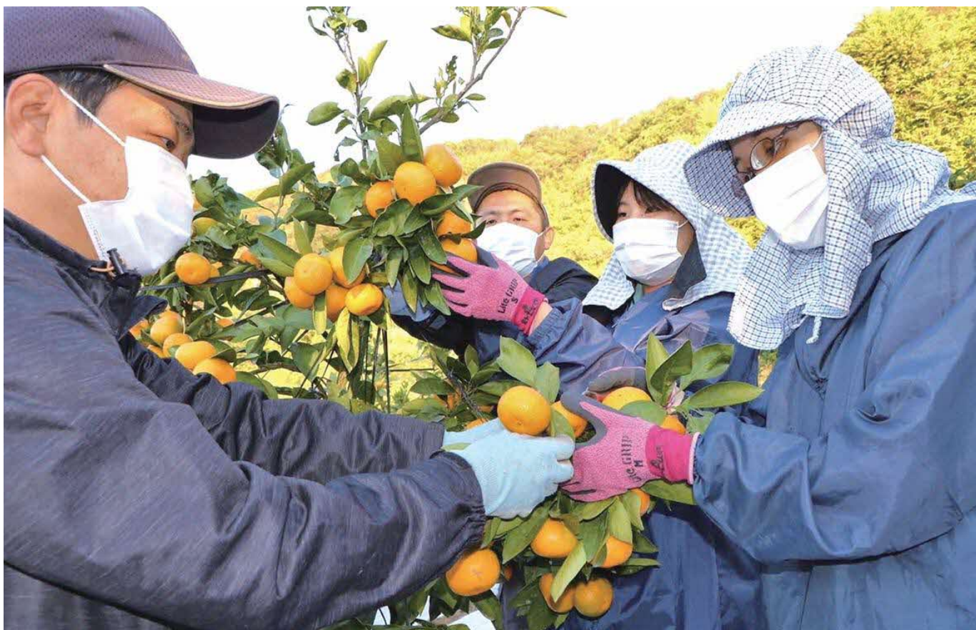
園地での収穫講習