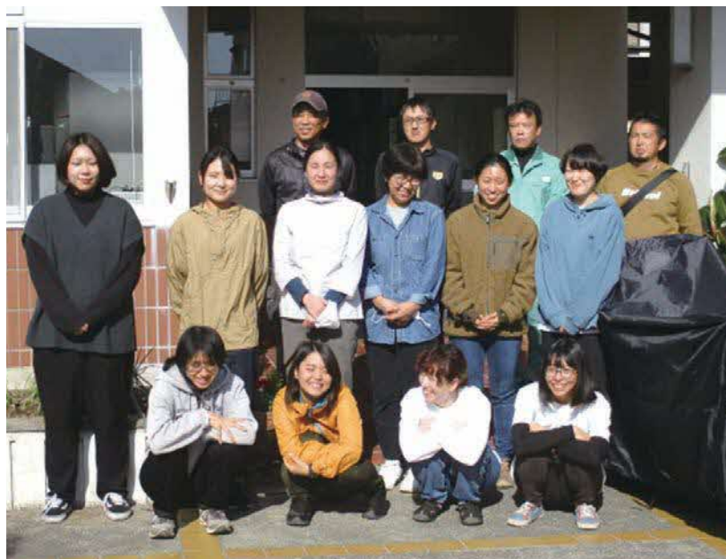
町見地区アルバイト 10名と受け入れ農家さん

今年度は受け入れ農家の数も増え雇用人数も増加する見込みであったため、利用していたシェアハウスでは宿泊が困難となり、新たな宿舎の確保が課題となっていました。そこで地元にある旧加周保育所をアルバイト者宿舎として利用するため、協議会が町から施設を借り受け、補助事業を活用し改修工事を行いました。