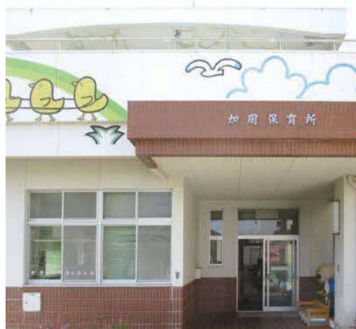
アルバイトー宿舎（旧加周保育所）