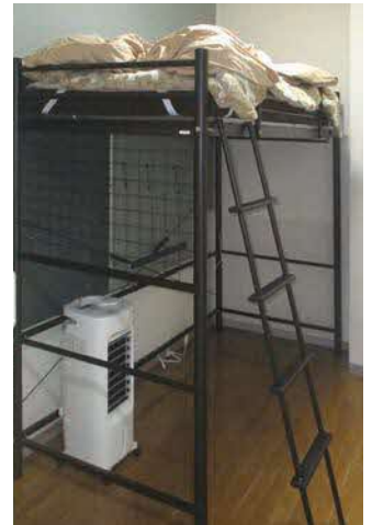
アルバイトーの個室

完成した施設は、最大10人の宿泊が可能です。11月5日から順次アルバイトーが来町し、受け入れ農家での収穫作業に励んでいます。