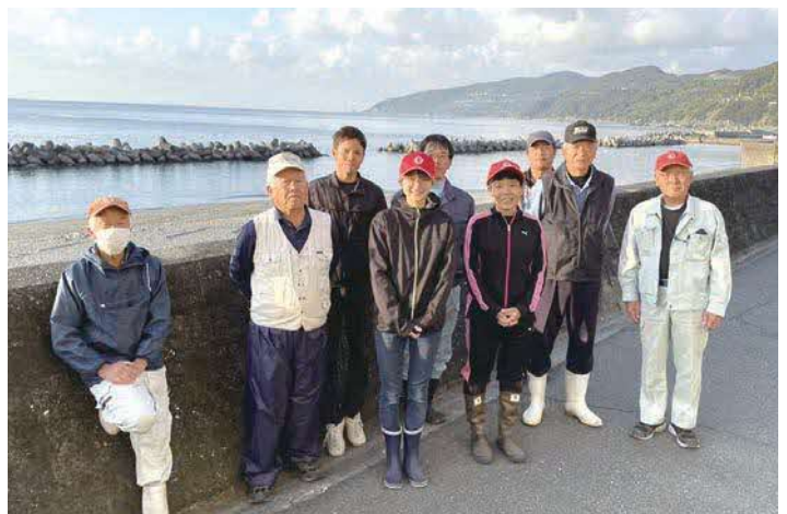
大久地区アルバイトー2名と受け入れ農家さん

今年は2名ですが、来年度は雇用人数を増やす計画で、受け入れ農家やアルバイトーの確保に努めていきます。