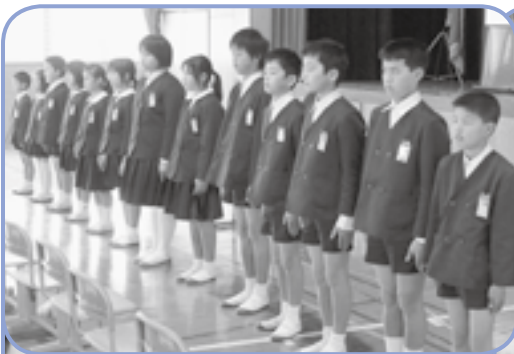
豊之浦小学校閉校式