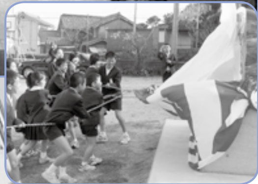
塩成小学校閉校式