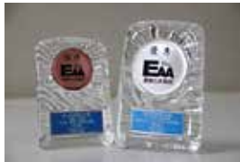
優秀賞（右）と佳作（左）のクリスタル盾

また、佐川印刷と制作した『日本一細長い半島佐田岬』の観光PRポスターが佳作を受賞しました。