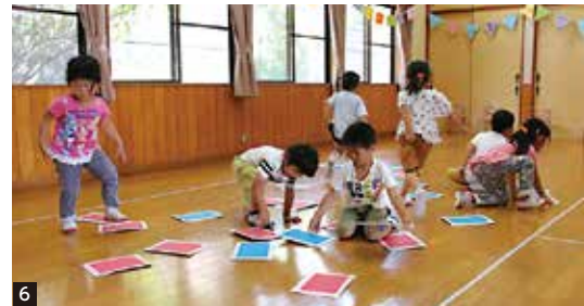
1_定番のかけっこ「よーいドン!」2_じゃんけん列車3・4_パン食い競争5_白熱の玉入れ6_どっちがおおい?赤勝て、青かて!