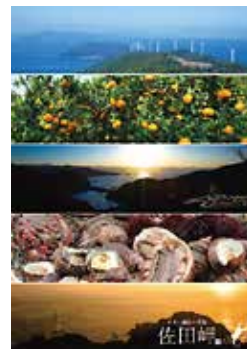
佳作を受賞した日本一細長い佐田岬半島の観光PRポスター