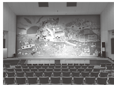
問 伊方町中央公民館 TEL 38-1020

当館の工事が完成した際には、皆様の文化及び芸術活動の場として、ご利用いただきますようご来館をお待ちしています。