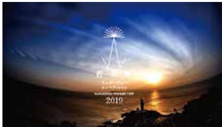
優秀賞を受賞した佐田岬ワンダービューコンペティションCM作品