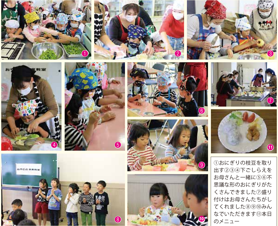
①おにぎりの枝豆を取り出す②③④下ごしらえをお母さんと一緒に⑤⑥不思議な形のおにぎりがたくさんできました⑦盛り付けはお母さんたちがしてくれました⑧⑨⑩みんなでいただきます⑪本日のメニュー

11月18日、三崎保健福祉センターでおやこの食育教室を開催し、三崎保育所の園児13人と保護者らが参加しました。