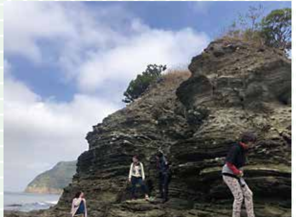
写真は小島の住吉神社の様子

全国にはたくさんのパワースポットと呼ばれているところがありますが、パワースポットは、神社やお寺、また、山や海、岩や木などに多いですね。そのたくさんある自然の中でもパワースポットと呼ばれるところは、そのほとんどが伝説や伝承が残る場所です。「佐田岬にはそんな有名な伝説も伝承もないし・・・。」そんな風に思っている人が多いと思いますが、実は佐田岬にもとても面白い伝説や伝承があります。伝説や伝承は作り話だと考えられ、最近あまり伝えられなくなってきました。「日本昔話」もそうですが、地域に残る伝説や伝承も、古くから伝わっているものであればあるほど、その中に当時の人たちの伝えたいことが込められていたりします。これらを「民俗学」とも言いますが、そんな地域の人たちがずっと受け継いできたことを、多くの人に知ってもらえる活動を今後も続けていきたいと思ひます。