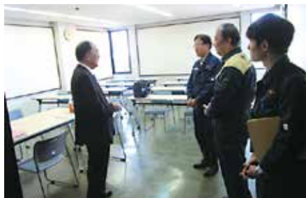
避難先の臼杵市にて、中野市長と面談する高門町長。