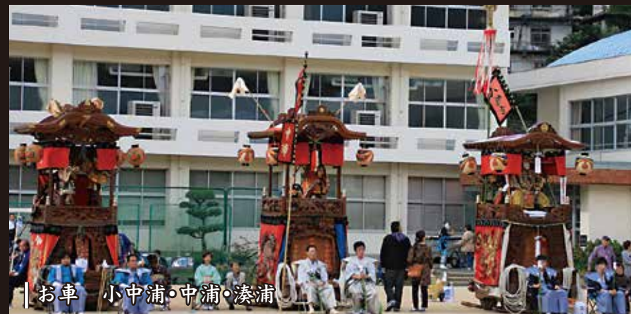
お車 小中浦・中浦・湊浦