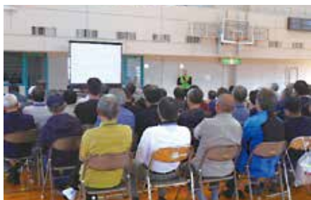
松前公園体育館では、県派遣者による避難所での生活についての講習会が行われました。