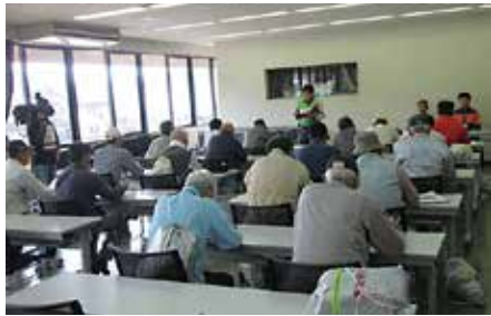
臼杵市中央公民館において、臼杵市の職員より問診を受けました