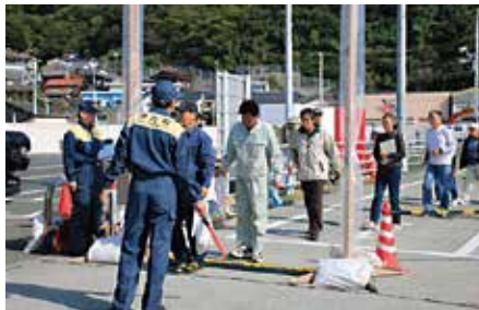
フェリーで避難する住民は、三崎港でスクリーニングを行った後、佐賀関港へ出発しました。