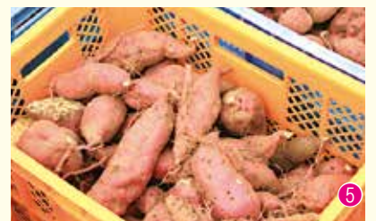
①②③傷つけないように丁寧に掘り上げる生徒のみなさん④⑤この日収穫したサツマイモ。被災地の方に喜んでほしいと話していました

10月23日、伽藍山体験農園で三崎中学校の生徒28人が特産のサツマイモを収穫しました。