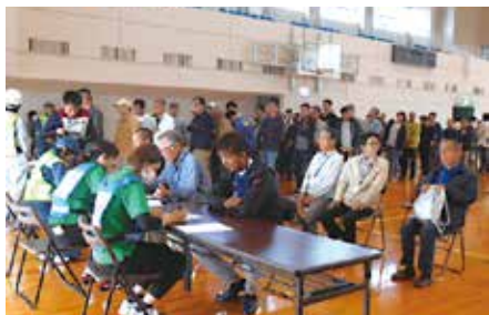
伊方・瀬戸地域の住民がバスで避難した松前公園体育館での、受付の様子。