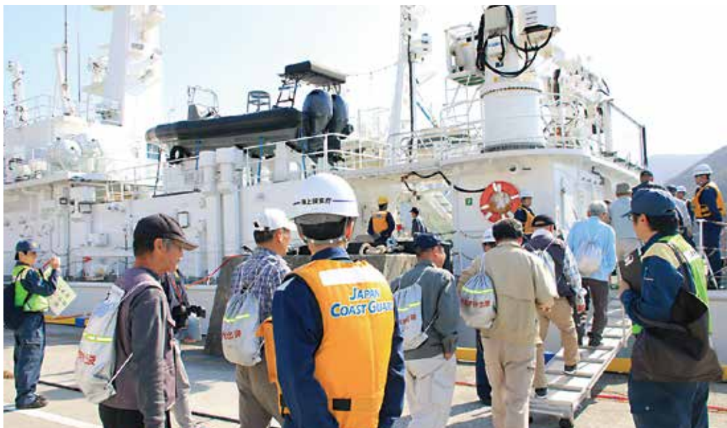
海上避難訓練の様子。三崎港で海上保安庁巡視船「いよ」に乗船する住民たち。白杵港へ向かいました。

10月30日、令和元年度愛媛県原子力防災訓練が実施され、愛媛県、近隣県（山口県、大分県、広島県、四国3県）、県内市町等自治体のほか、自衛隊、消防、警察などの関係機関と住民が参加しました。