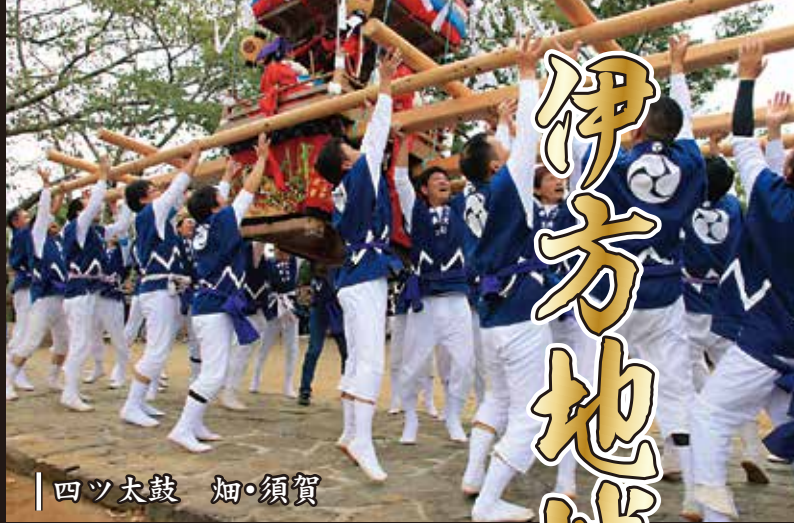
四ツ太鼓 畑・須賀