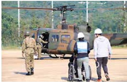
要配慮者の避難訓練。要配慮者に見立てた三崎つわぶき荘職員を三崎高校から陸上自衛隊のヘリで東温市へ搬送しました。