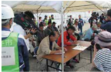
臼杵港到着時の様子。