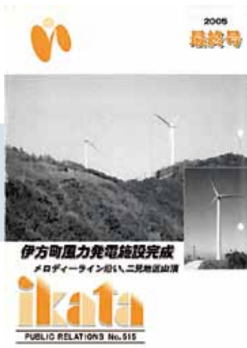
▲広報いかた最終号（平成17年3月号） 昭和37年から発行された広報いかたは515号で最終号となりました。