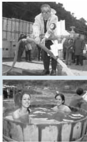
▲広報いかた500号（平成16年1月号） 伊方保育所のもちつきの様子が表紙を飾った500号。亀ヶ池温泉発掘成功のニュースが掲載されていました。