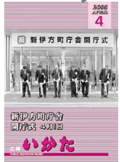
▲広報いかた第1号（平成17年4月号） 新伊方町の幕開けを、開庁式の様子とともにお伝えしました。