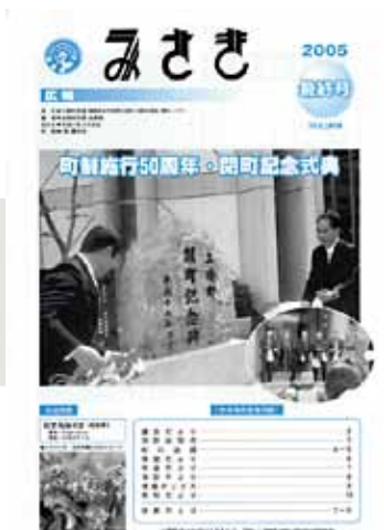
▲広報みさき最終号（平成17年3月号） 町制50周年・閉町記念式典の様子とともに、269号まで続いた広報みさきが終わりを迎えました。