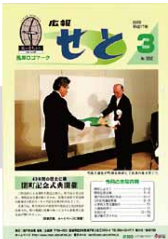
▲広報せと最終号（平成17年3月号） 382号で最終号となった広報せとの表紙は閉町記念式典の様子でした。