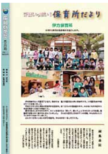
▲広報いかた74号（平成23年5月号） 表紙の全面縦型写真にリニューアルに合わせて裏面もリニューアル。