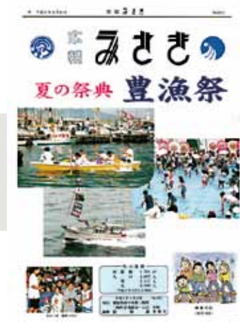
▲広報みさき193号（平成8年9月号） 三崎町の一大会豊漁祭の第10回の様子が掲載されていました。