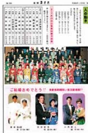
▲広報みさき200号（平成10年1月号） 現在まで続く健康マラソンの様子が表紙に。その他、成人式の様子などが掲載されていました。