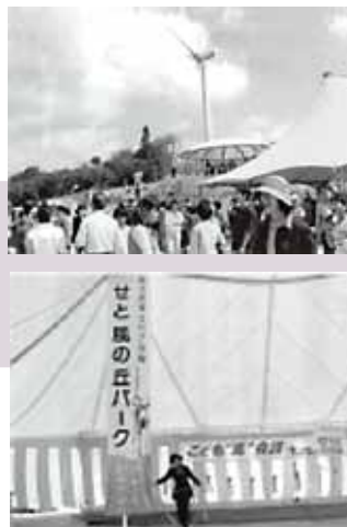
▲広報せと365号（平成15年10月号） 風力発電施設の完成を記念して開催した「風車まつり」のにぎわいを掲載。「せと風の丘パーク」の名称も決定しました。