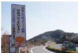
平成23年2月 メロディー道路完成♪