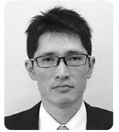
高月 芳人 議員

11月7日、様々な行政分野における優れた先進事例を学び、本町の振興施策の参考とすることを目的に、北海道泊村へ視察にお伺いしまし