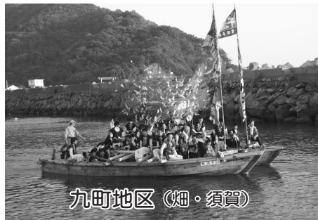
九町地区(畑・須賀)