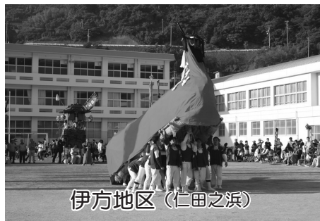
伊方地区(仁田之浜)