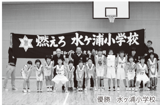
優勝 水ヶ浦小学校