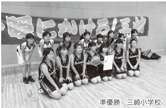
準優勝 三崎小学校