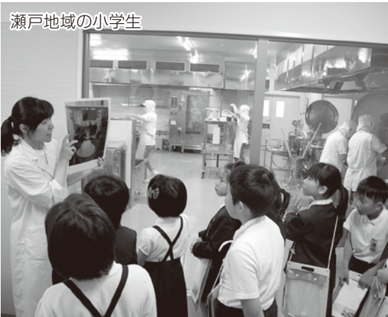
瀬戸地域の小学生

子どもたちは、今まで行ったことのない施設も見学でき、伊方町のことをより深く知ることができた良い経験になったようです。