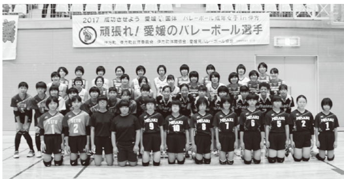
昨年のバレーボール教室から(開会式後に記念撮影)