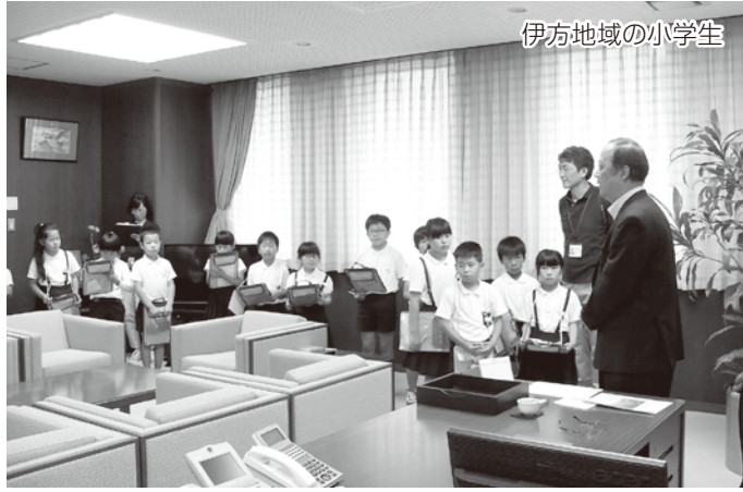
伊方地域の小学生