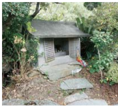
伊養様(伊方町指定史跡) 一塩成一

★もし史跡・名勝・天然記念物に工事がかかるような場合、また影響を与える恐れがあるとき