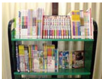
平成28年度共同募金受配図書

伊方町共同募金委員会より、児童用図書資料91点を寄贈していただきました。今回いただいた資料は、地域や家庭での読み聞かせや読書の時間、学校の調べ学習など、子どもの読書活動に幅広く活用されます。