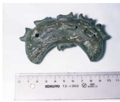
子持勾玉(伊方町指定有形文化財) ※考古資料

★工事内容や状況等によっては、「発掘調査」でなく、専門職員が立ち会う「工事立会」や、包蔵地であることを念頭に「慎重工事」という判断もあり、すべてが長期の工事中断となる訳ではありません。