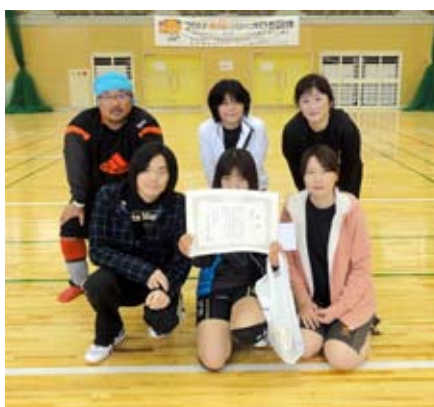
優勝チーム あっかり一す