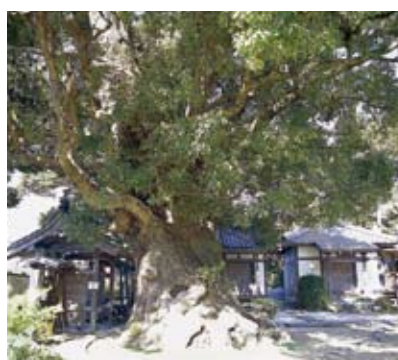
大クス(伊方町指定天然記念物) 一三崎一

★また自然災害等で損傷したり、修理が必要になった場合も、それぞれ損傷届や修理届が必要で、くわしくは教育委員会にお尋ねください。