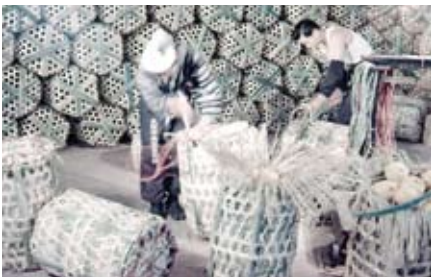
ダイダイカゴに夏柑を詰める (三崎・昭和35年ころ)

参考文献『えひめ、昭和の記憶 ふるさとのくらしと産業II 伊方町』(愛媛県教育委員会発行二〇一二年) など