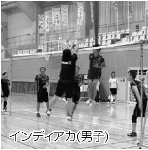
インディアカ(男子)