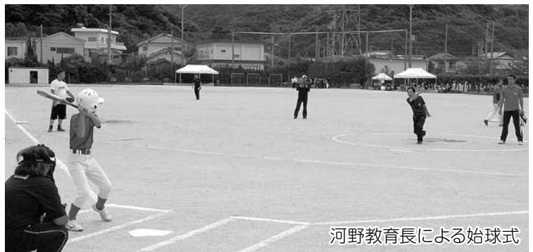
河野教育長による始球式

せみの鳴き声が響く8月14日(月)、第67回夏季体育大会が開催され、4種目(ソフトボール、レクバレー、卓球、体験コーナーのソフトテニス)の球技が行われました。 この大会は毎年、お盆に行われる伝統行事で、子どもから高齢者までの幅広い参加者があり、誰もが楽しみながら交流を深めました。 団体戦のソフトボールは8チーム、レクバレーは5チームの参加があり、地区対抗で、