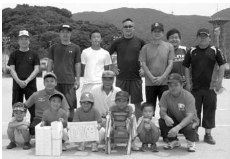
ソフトボール優勝の札幌チーム