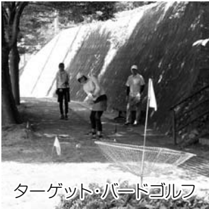
ターゲット・バードゴルフ