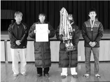
2部男子優勝 伊方サービスA