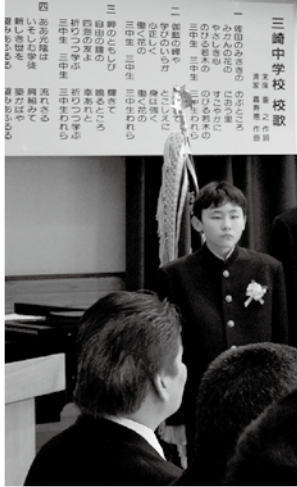
三崎中学校式典の様子