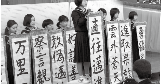
瀬戸中学校式典の様子