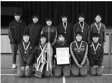
2部女子優勝 伊方中バスケ部