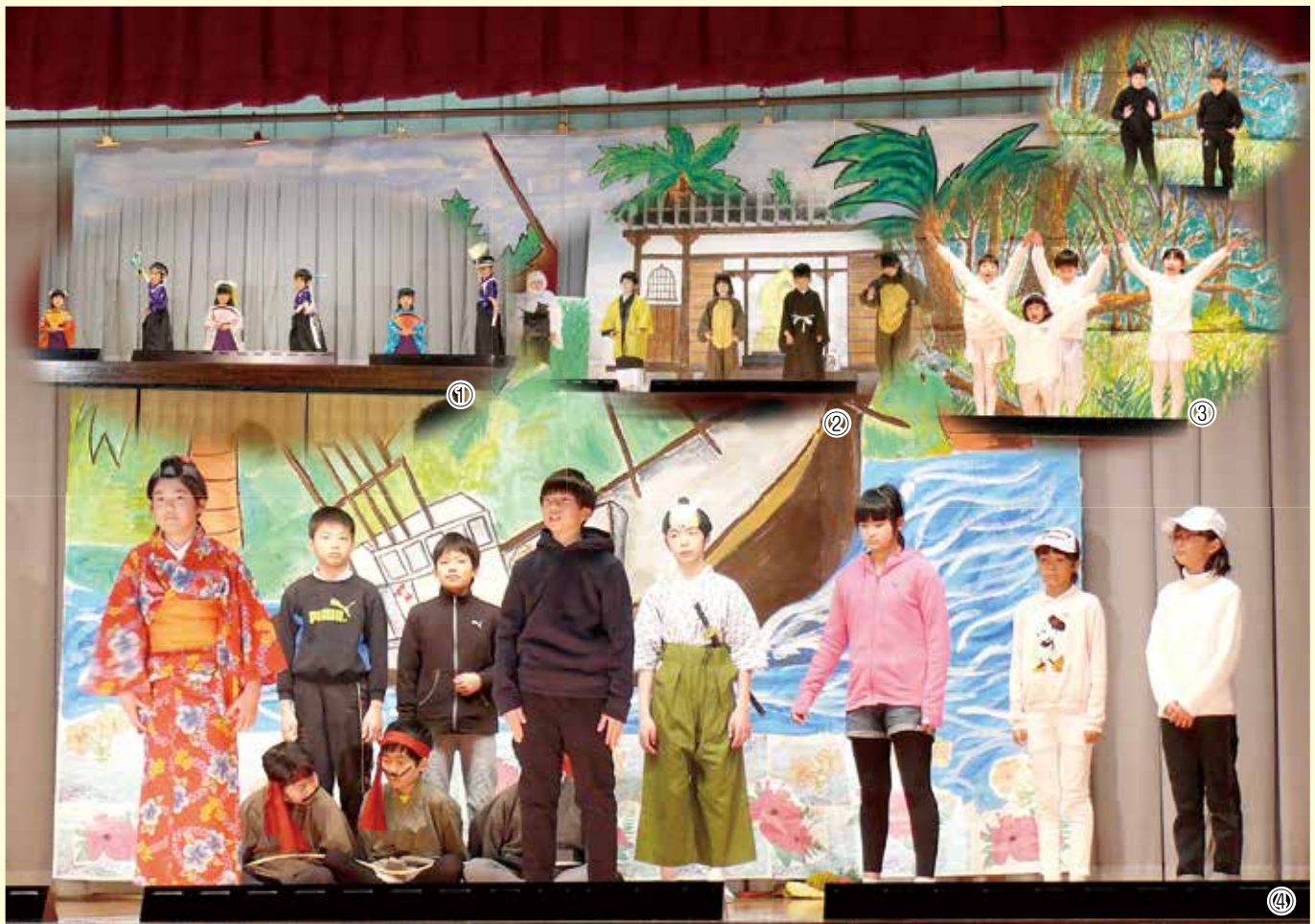
水ヶ浦小学校学芸会 (2月10日(土))