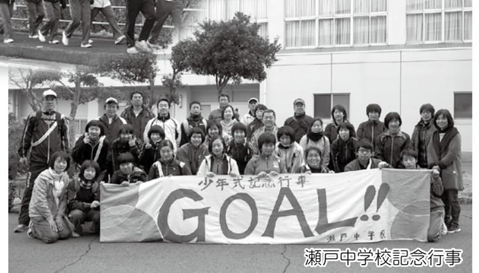
瀬戸中学校記念行事

2月2日(金)、町内の各中学校において少年式が開催されました。今回、少年式を迎えた中学2年生は、伊方中学校41名、瀬戸中学校12名、三崎中学校12名です。 少年式は、昔の「元服」に当たるもので、14歳のお祝いとして愛媛県内の中学校では昭和39年から行われています。14歳になると少年法の施行対象となり、自分の行動に責任を持たなければいけないので「自覚」「立志」「健康」の3つを目標に定めています。 式典ではどの中学校も生徒一人ひとりが決意を発表しました。 式典の後は、各中学校で記念行事が行われました。伊方中学校では、少年の日記念ウォークとして旧伊方町内27.2km、瀬戸中学校では、NEWウォークとして未来への挑戦として旧瀬戸町内21.1km、三崎中学校では、メロディーウォークとして輝け未来へとして役場本庁から三崎中学校までの30kmを歩きました。 長い人生の中で、一つの節目である少年式を迎え、それぞれの生徒が、自分の将来について考え、成長できた一日になったことでしょう。