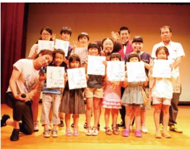
出演者とのじゃんけん大会後の記念撮影

また、最後には出演者によるじゃんけん大会が行われ、勝ち残った10人にはサイン色紙がプレゼントされました。出演者とふれあえ、良い記念になったと思います。