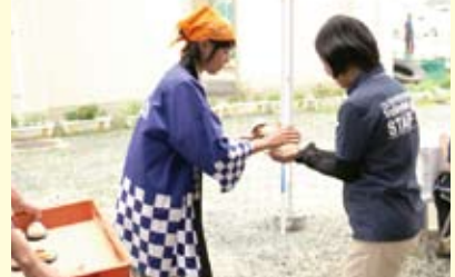
「みっちゃん大福」でおもてなし (三崎高校VYS部)