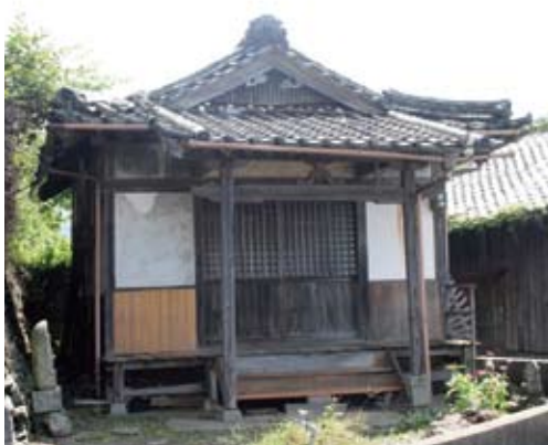
湊浦の阿弥陀堂 (2016年7月撮影)