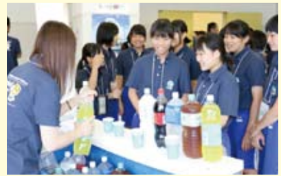
ドリンクサービスコーナー(無料)