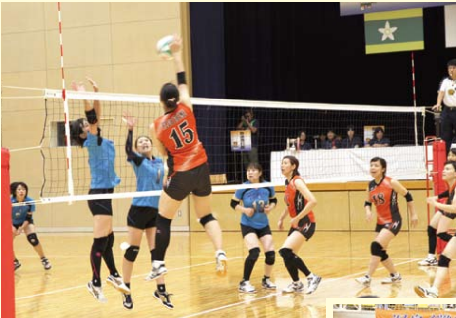
【決勝戦】CLUB EHIME (愛媛県) 対 せとうちPRIOR (香川県)