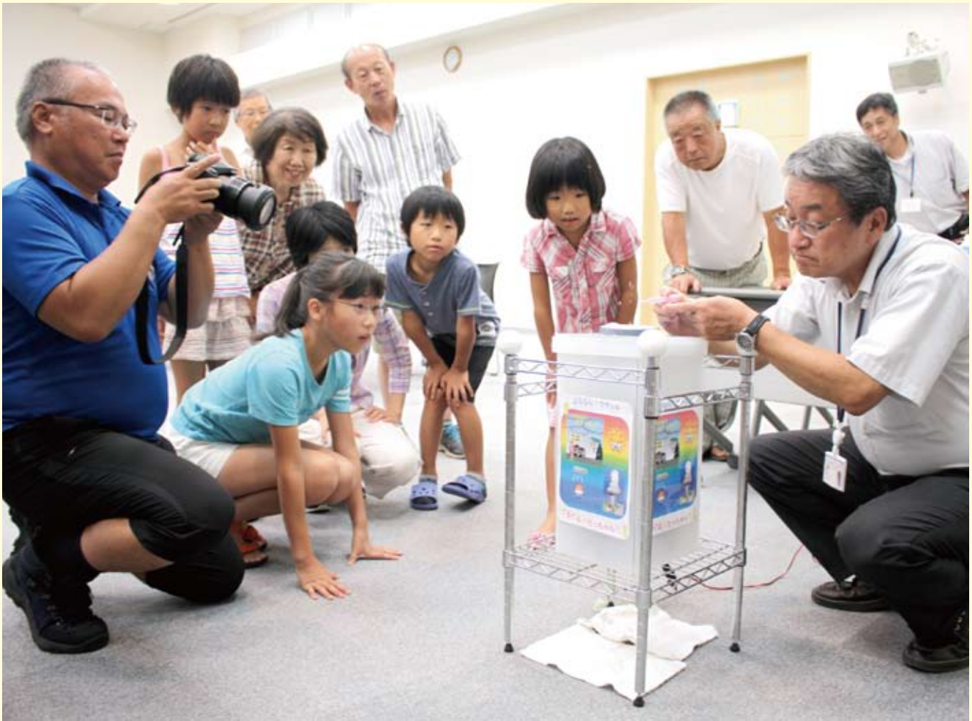
雨つぶの形を再現する実験に、子どもも大人も注目!