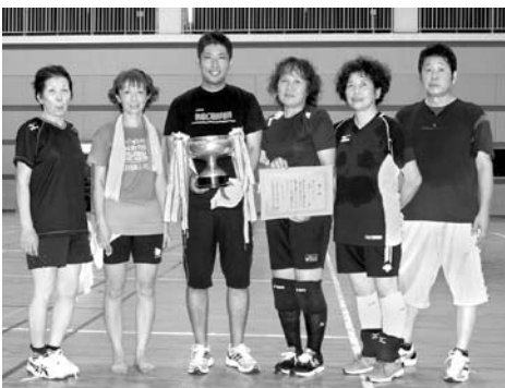
レクバレー優勝の二名津チーム

卓球と体験コーナーのソフトテニスでは、大人から子どもまでの幅広い参加があり、それぞれにスポーツを楽しみました。今年もお盆休みを利用し帰省してきた人を変え、懐かしい顔との久しぶりのプレーに参加者全員がさわやかな汗を流し、楽しいひと時を過ごしました。