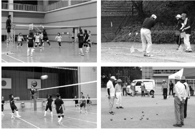
【写真】 (左上) インディアカ、(右上) ターゲット・バードゴルフ、(左下) レクバレー、(右下) ペタンク

この大会は、愛媛スポレク祭2016参加代表チーム等の選抜及びスポーツを通じた町民の交流を目的としています。