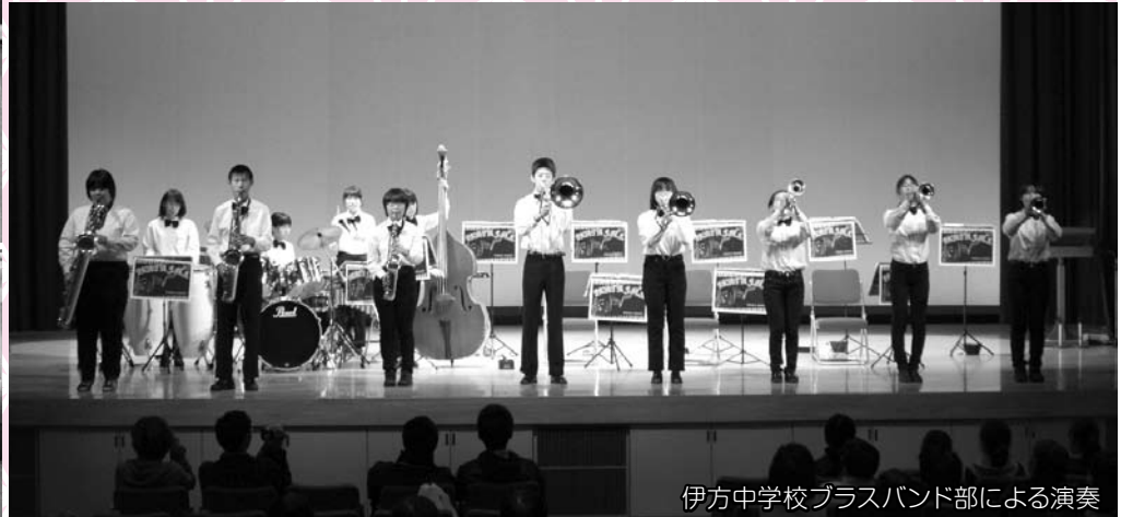
伊方中学校プラスバンド部による演奏