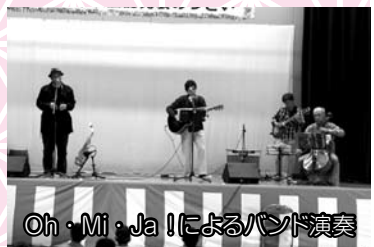
Oh・Mi・Ja!によるバンド演奏