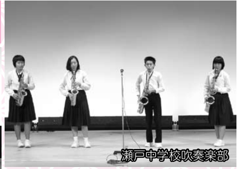
瀬戸中学校吹奏楽部