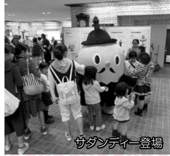
サダンディー登場