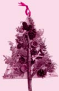
※写真は、イメージです。