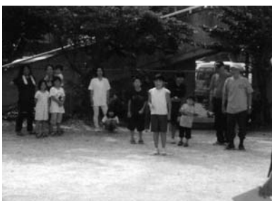
三世代ペタンク大会(大浜)