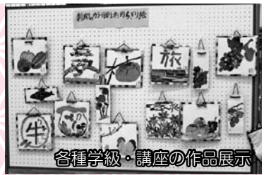
各種学級・講座の作品展示