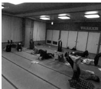
健康体操教室(小中浦)