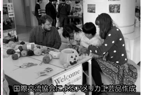
国際交流協会によるアメリカ工芸品作成