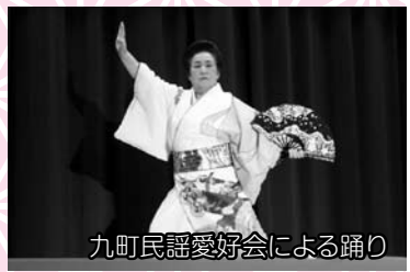
九町民謡愛好会による踊り