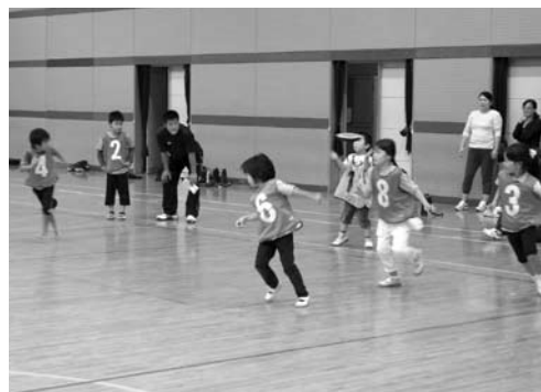
コート狭しと駆け回る児童

に悪戦苦闘する場面もありましたが、すべて「コツをつかみ、ドッジボールのように楽しんでいました。 参加された児童はどちらの種目でも元氣いっぱいコート狭しと駆け回り、爽やかな汗を流していました。