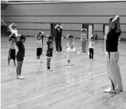
ケガをしないように準備運動

10月22日(土)、三崎総合体育館で三崎小学校の児童が集まり、「小学生ドッジボール大会」が開催されました。 今年度の種目はドッジボールとドッジビーです。集まった三崎小学校の児童は高学年と低学年、それぞれ3チームずつに分かれてリーグ戦を行いました。 ドッジボールでは、どの児童もボールを避けたりキャッチして反撃したりする度に歓声が湧き上がり、元気にコートの中を駆け回っていました。 このドッジボール大会では毎年、ドッジボールと、もう1種目のゲームを行っており、今年度のもう1種目がドッジビーでした。ドッジビーは、ドッジボールのボールを柔らかいフリスビーに変えたスポーツです。ボールと相手の違つフリスビー