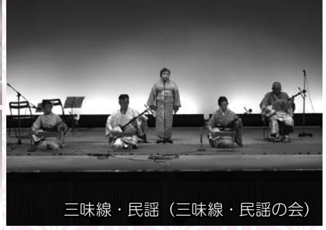
三味線・民謡 (三味線・民謡の会)