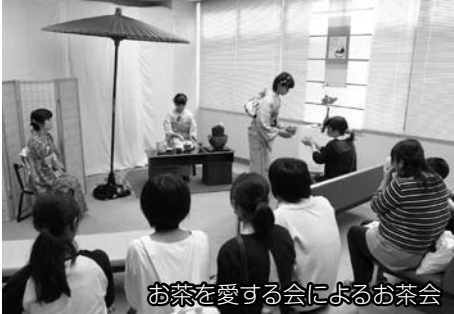
お茶を愛する会によるお茶会