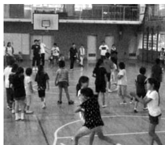
親子ふれあい広場(湊浦1)