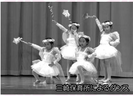
三崎保育所によるダンス