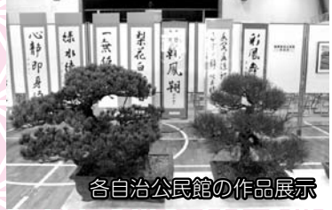
各自治公民館の作品展示