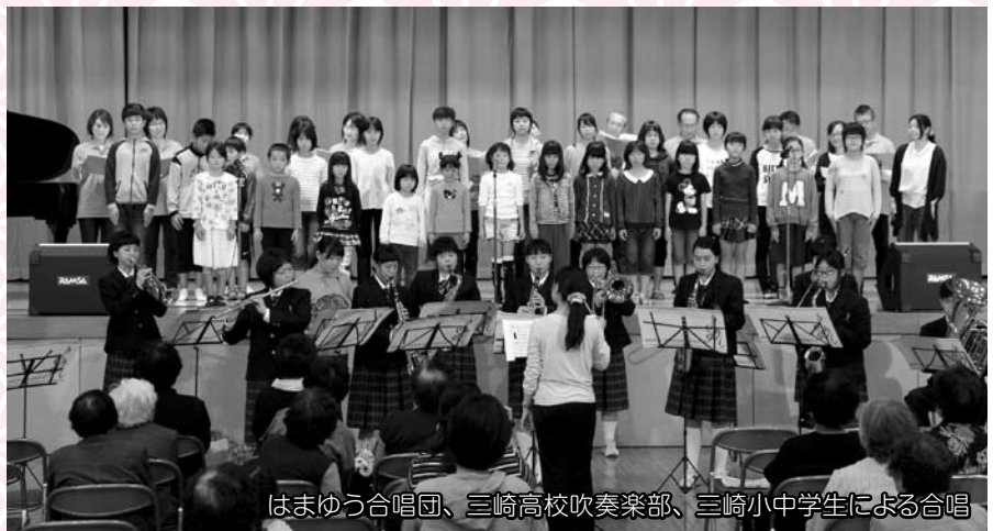
はまゆう合唱団、三崎高校吹奏楽部、三崎小中学生による合唱