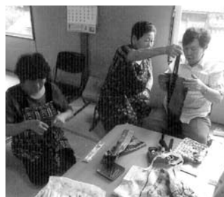
手芸講習会(伊方越)