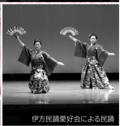
伊方民謡愛好会による民踊