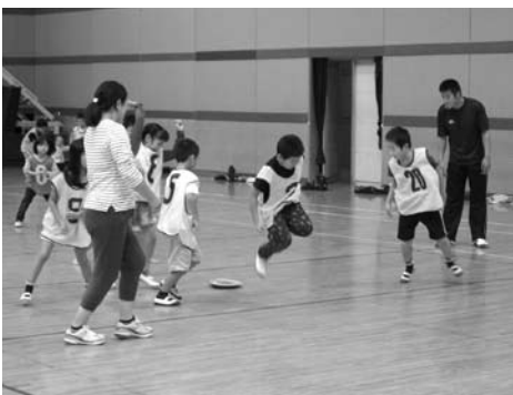
上手に避けました!

10月22日(土)、三崎総合体育館で三崎小学校の児童が集まり、「小学生ドッジボール大会」が開催されました。 今年度の種目はドッジボールとドッジビーです。集まった三崎小学校の児童は高学年と低学年、それぞれ3チームずつに分かれてリーグ戦を行いました。 ドッジボールでは、どの児童もボールを避けたりキャッチして反撃したりする度に歓声が湧き上がり、元気にコートの中を駆け回っていました。 このドッジボール大会では毎年、ドッジボールと、もう1種目のゲームを行っており、今年度のもう1種目がドッジビーでした。ドッジビーは、ドッジボールのボールを柔らかいフリスビーに変えたスポーツです。ボールと相手の違つフリスビー