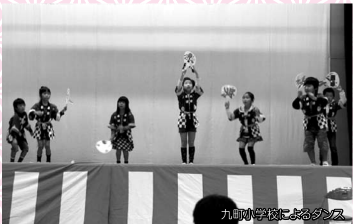
九町小学校によるダンス