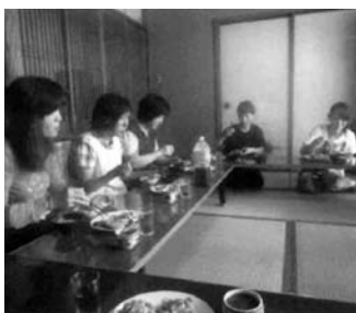
料理講習会(中之浜)