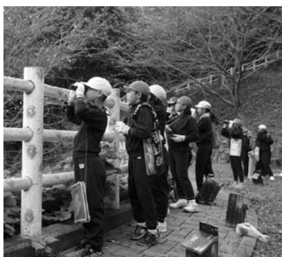
バードウォッチング