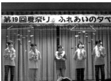
夏祭り・ふれあいの夕べ(川永田1)

自治公民館活動を通じ、地域の活性化をより推進するために、各地区の自治公民館主事さんが企画する事業に対し町から助成されるもので、9月末現在で9地区16事業が行われています。 内容は、三世代交流、手芸、料理講習、スポーツ大会など、地域において多種多様な特色のある催しを実施されており、このような活動をとおして学習意欲の向上、親睦が図られ地域づくりにつながっています。