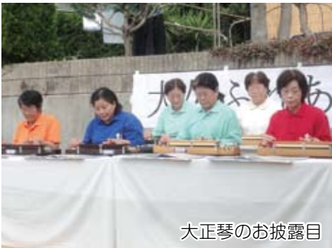
大正琴のお披露目