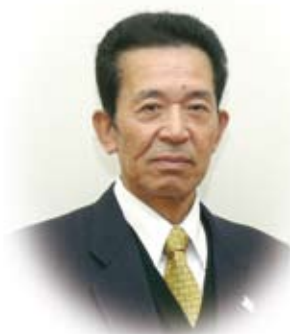
伊方町教育委員会 教育長