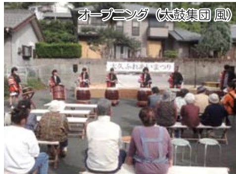
オープニング（太鼓集団 風）