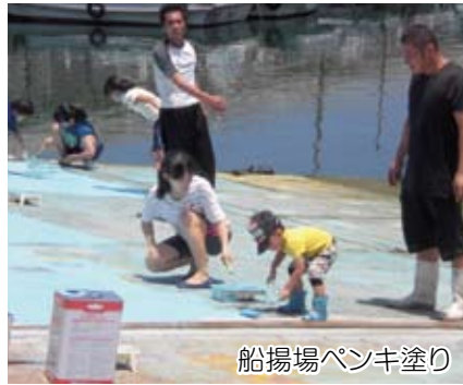
船揚場ペンキ塗り