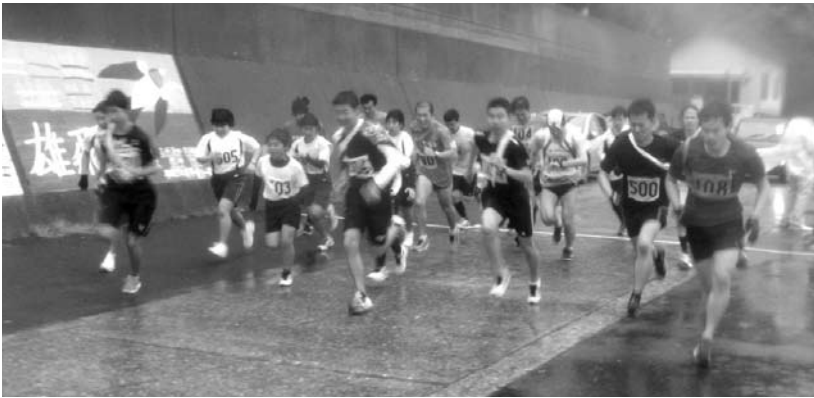
瀬戸駅伝13.3kmのスタート

あいにくの雨天ではありましたが参加した21チーム全員が四ツ浜地区体育館から三机小学校グラウンドまでのコースを無事完走することができました。