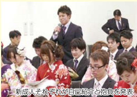
新成人それぞれが自己紹介と抱負を発表