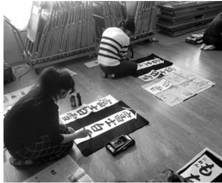
三机小学校会場の様子

新春の恒例行事、「新春書初め大会」を1月6日（金）、三机小学校・四ツ浜地区体育館の2会場で開催し、三机・大久小学校の児童43名が参加しました。 今年は、各小学校の先生にご指導頂きながら、児童たちは