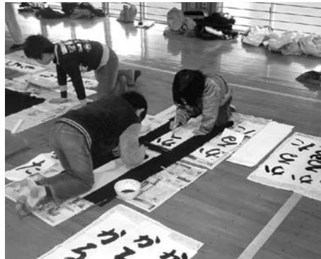
四ツ浜地区体育館会場の様子

は何度も練習し、新春を飾る自慢の力作を完成させました。書きあがった作品は、町民センターロビーに掲示しております。是非ご覧下さい。