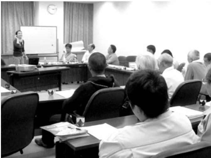
武山准教授より中間報告

引き続き調査を行い、愛媛大学からアドバイスをいただきながら集落ぐるみによるイノシシ被害防止対策を進めていく予定です。