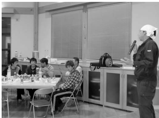
交流会で意見交換する青年農業者と大学生