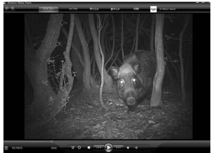
カメラに映ったイノシシ