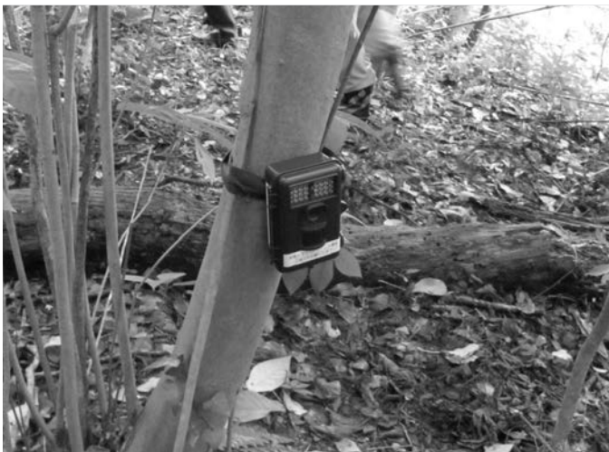
設置されたセンサーカメラ