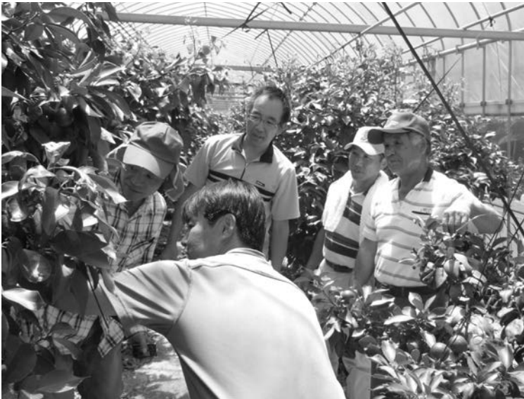
視察研修（紅まどんなの施設栽培）