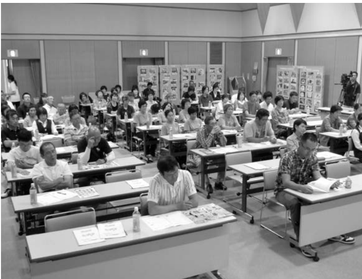
認定農業者も参加した「農業者フォーラム」

現在、当伊方町と八幡浜市であわせて592人が認定農業者として認定され、そのほとんどの方が、会員相互の連携と研鑽、さらには“足腰の強い農業経営確立”を目指し、「八西地区認定農業者等協議会」組織で活動されています。今回は、その協議会の活動を紹介します。