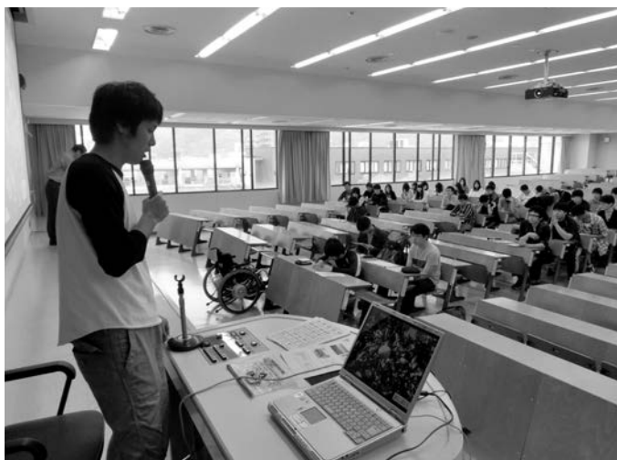
松山大学で講義する青年農業者