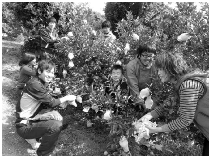
サンテ掛けをする青年農業者と大学生

参加した学生らは、「体験したことで農業に対するイメージが変わったので、農作業のアルバイトやボランティアをしたい」とか、「単調な作業の繰り返しが大変だった」等と感想を述べ、また、青年農業者は「次年度も継続して実施したい」と話していました。