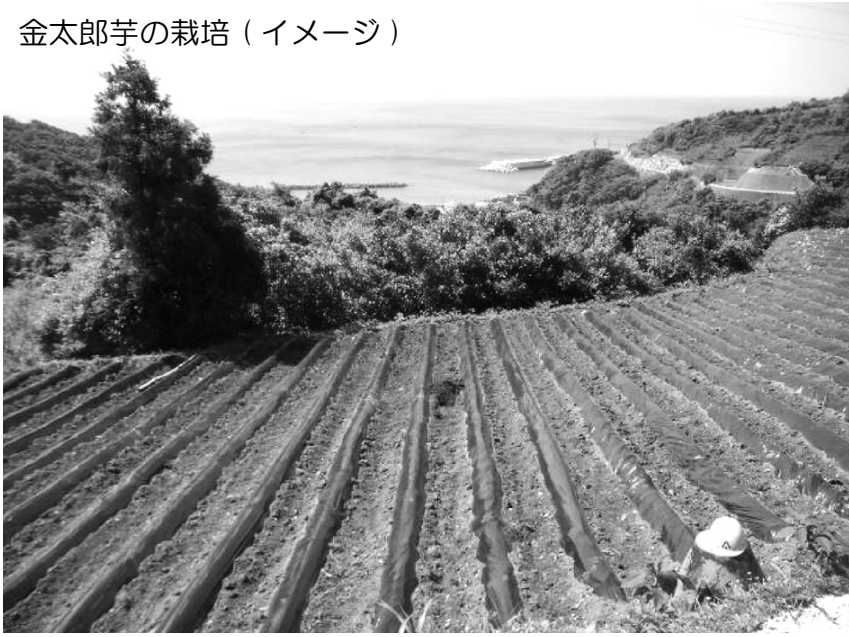
金太郎芋の栽培（イメージ）